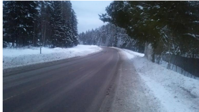
ФЕДЕРАЛЬНАЯ ДОРОГА А129