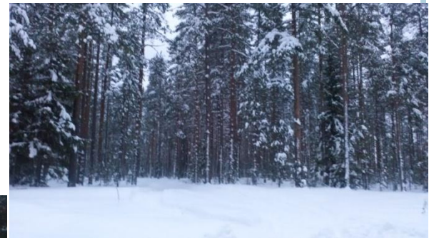
в лесу около озера Купальное