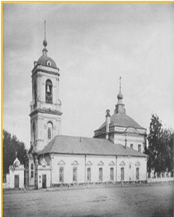
Преображенский храм (1882 год)