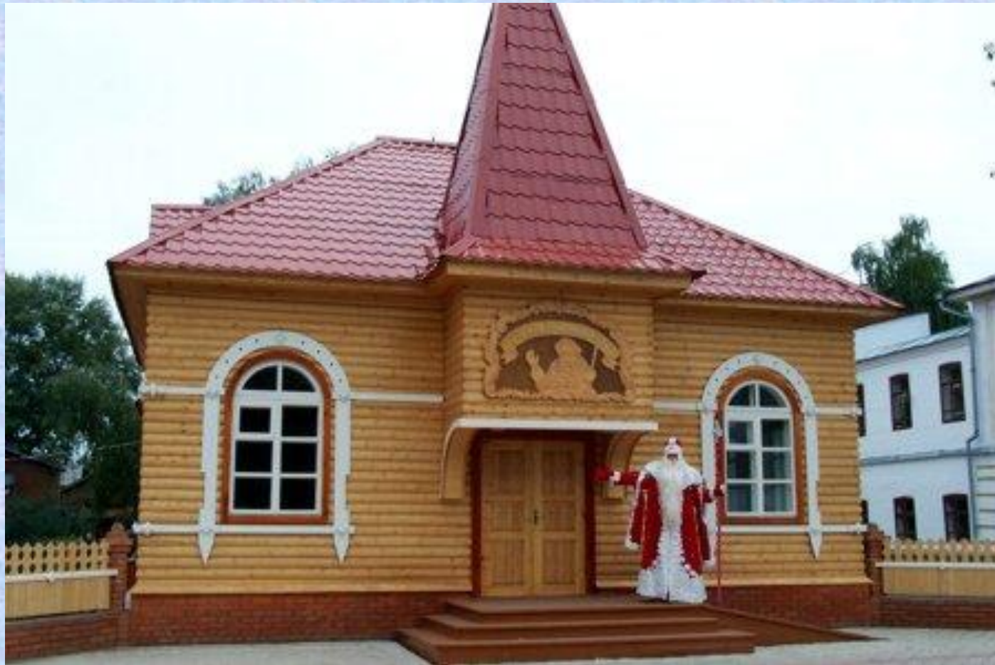
Почта Деда Мороза

Почта Деда Мороза находится в центре города Великий Устюг в красивом деревянном тереме.