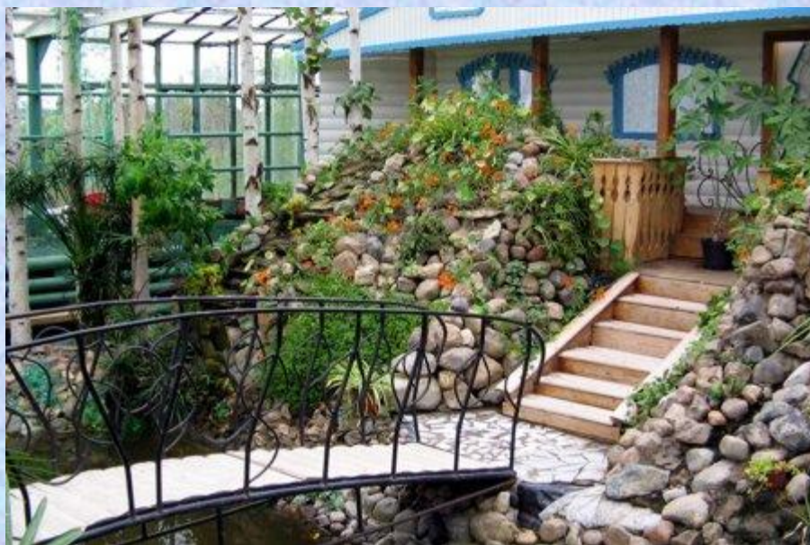
зимний сад Деда Мороза.