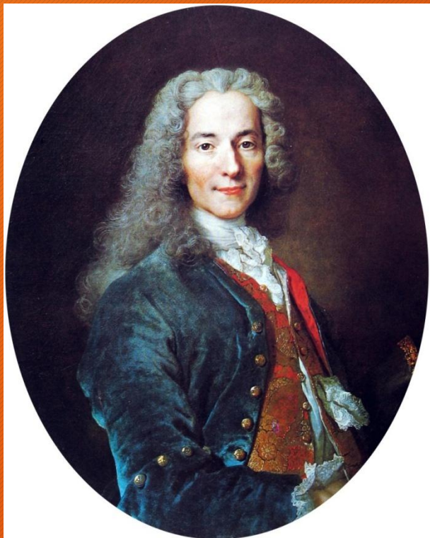
Франсуа-Мари Аруэ Вольтер