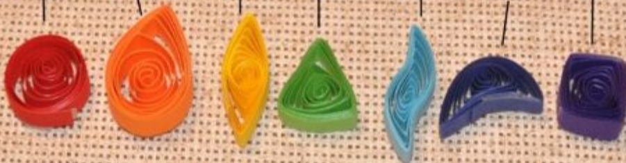
"Спираль" "Капля" "Глаз" "Треугольник" "Листик" "Месяц" "Квадрат"