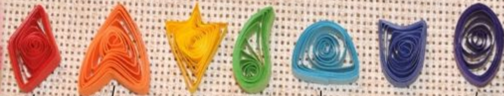
"Ромб" "Стрела" "Ладья" "Крыло" "Полукруг" "Тюльпан" "Овал"