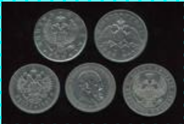
Рубли XVIII века