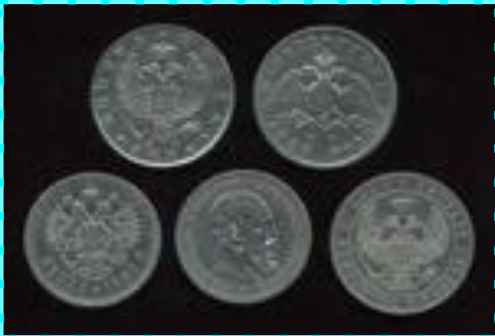
Рубли XVIII века