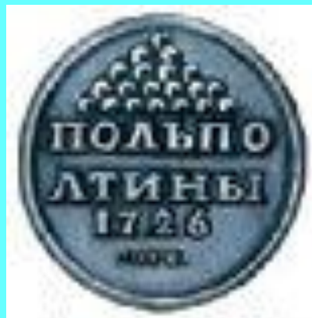
Полполтина 1726 г