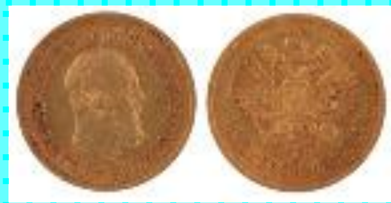
Полтина Петра II