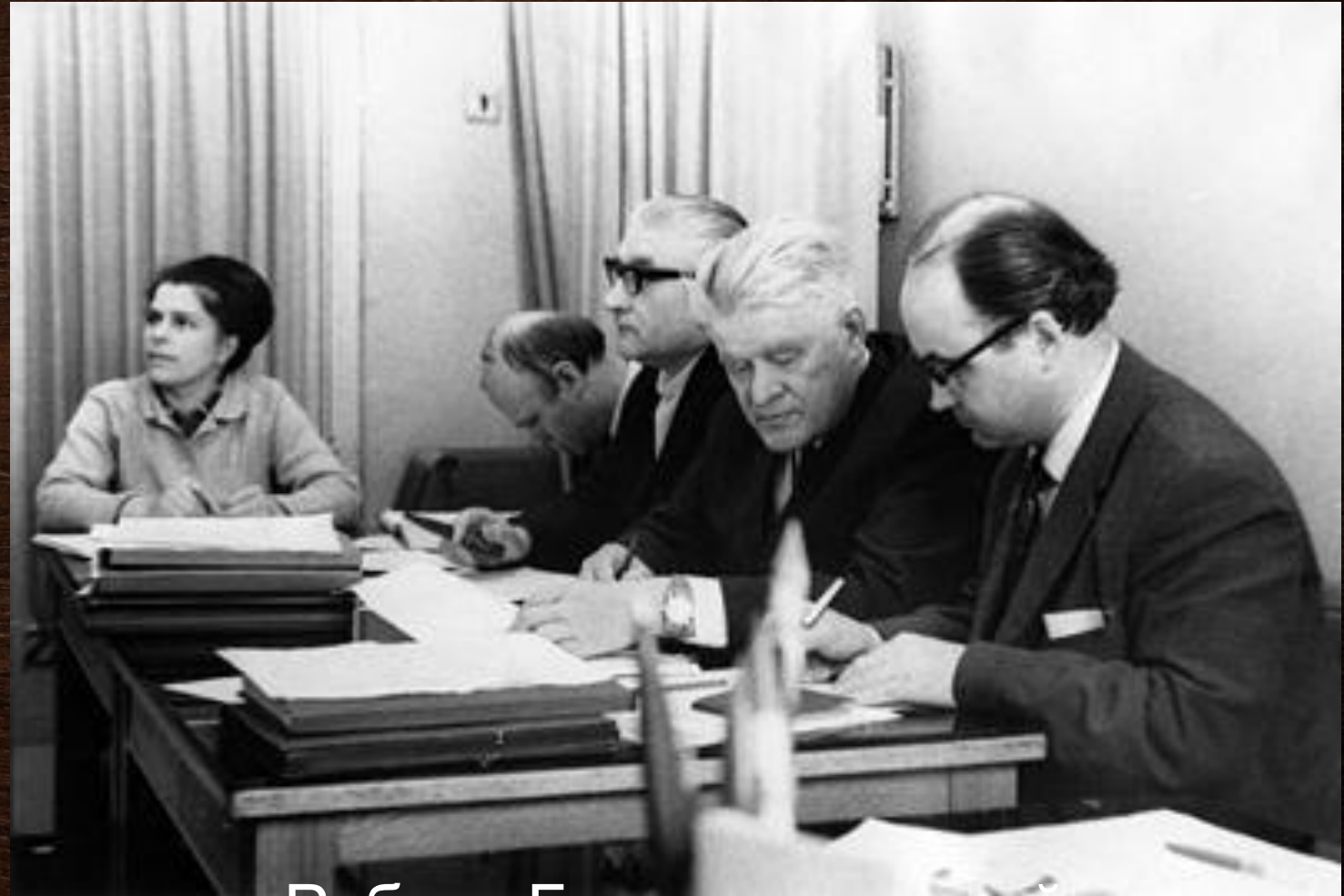
Работа Государственной экзаменационной комиссии