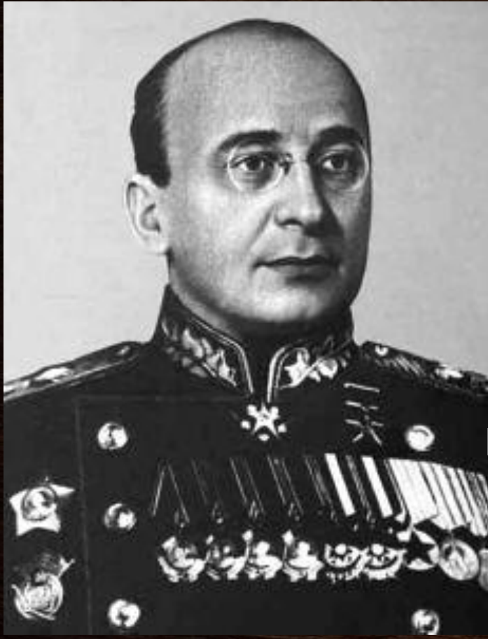
Зам.Председателя ГКО Л.П. Берия

Постановление № 1871—872с Совета Народных Комиссаров (СНК) СССР об образовании Московского механического института боеприпасов (ММИБ)