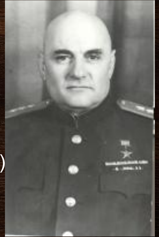
нарком боеприпасов Б.Л. Ванников

Постановление № 1871—872с Совета Народных Комиссаров (СНК) СССР об образовании Московского механического института боеприпасов (ММИБ)