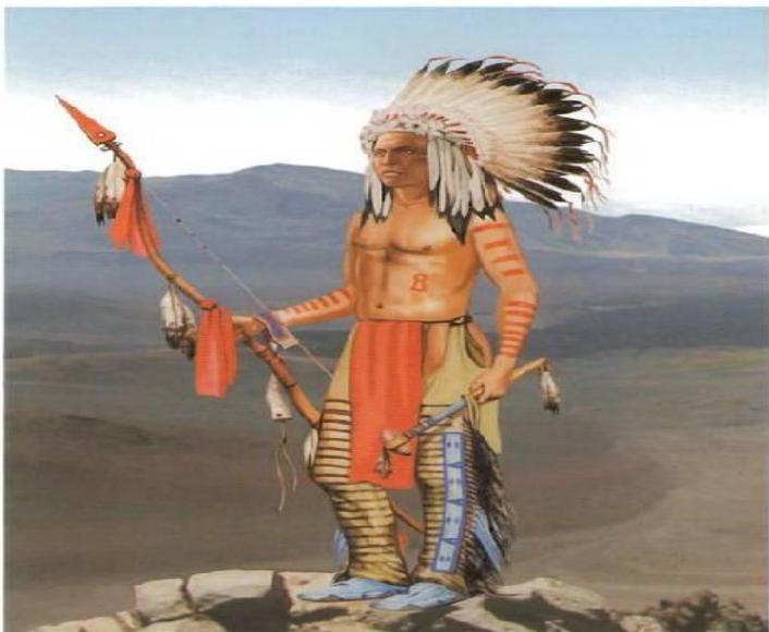
Вождь ассинибойнов 1850–1870 гг. в традиционном уборе из перьев. Вооружен луком-копьем и палицей с наконечником из камня.