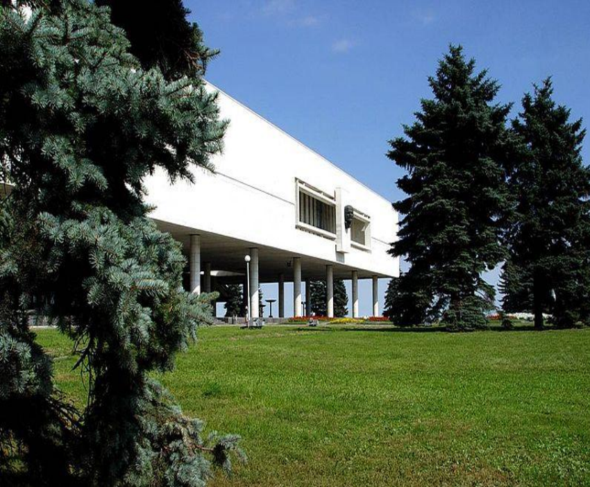
Дом-музей В.И. Ленина