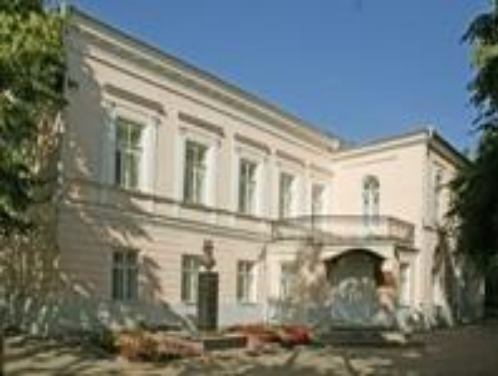
Литературный музей "Дом Языковых"