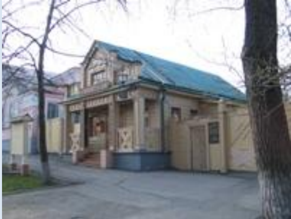
Музей "Мелочная лавка"