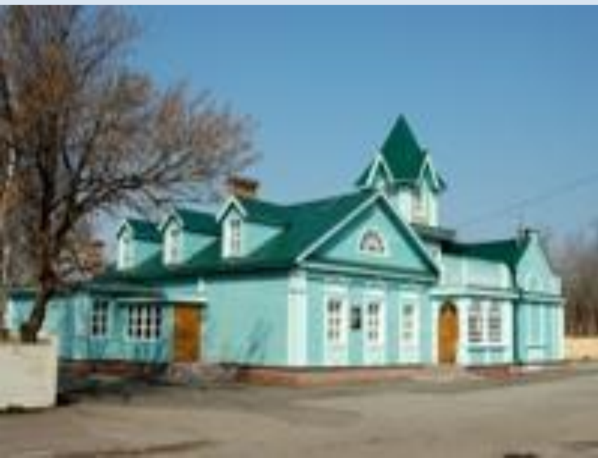
Музей "Симбирская фотография"