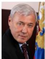
Аксаков Анатолий Геннадьевич