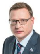
Бурков Александр Леонидович