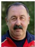
Газзаев Валерий Георгиевич