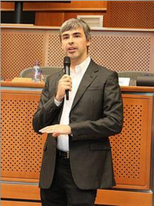
Лари Пейдж (Larry Page)

Поисковая система появилась в 1998 г. „Googol“ – это математи- ческий термин, обозначающи й единицу со ста нулями.