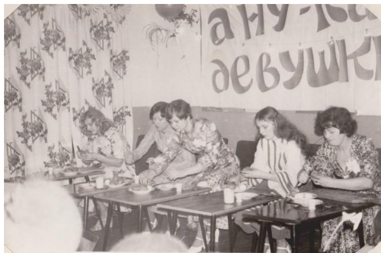
Немало выдумки, ловкости приходится проявить девушкам