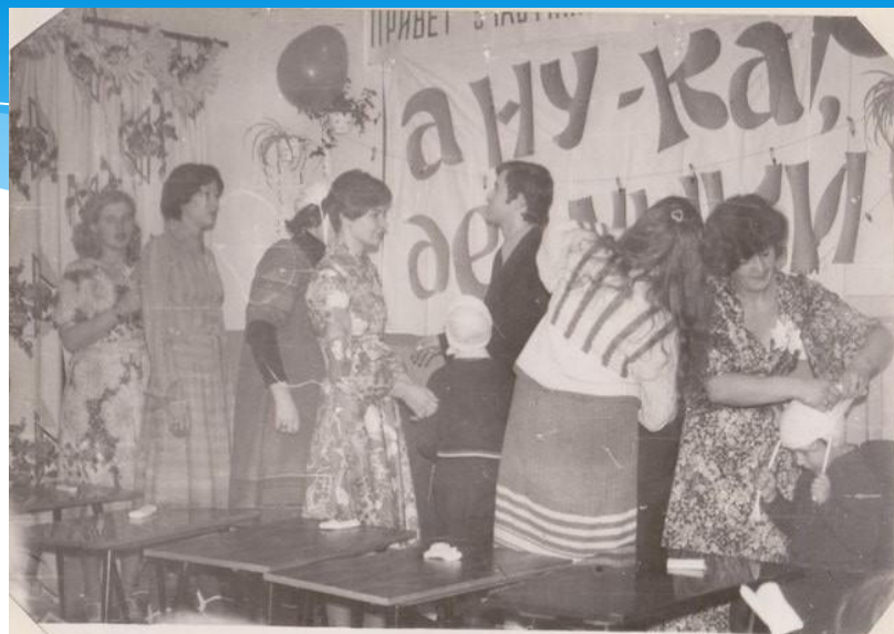
Повязка "чепец" - это совсем не просто, к тому же дано определенное время, значит, надо спешить