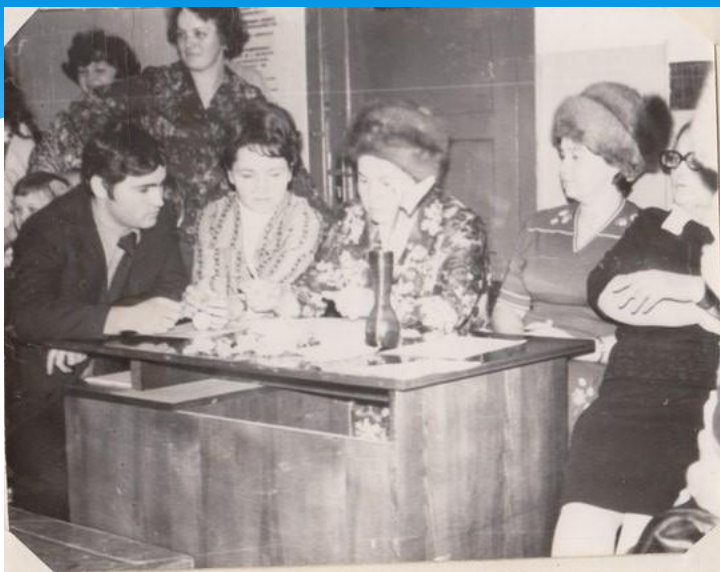
Компетентное жюри уже готово объективно оценить работу участников конкурса