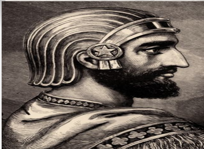
Персидский царь «Кир»