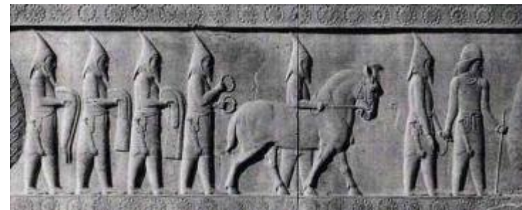
Скифы сакских племен