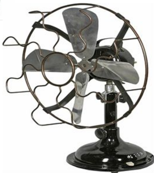
Кондовий настільний вентилятор