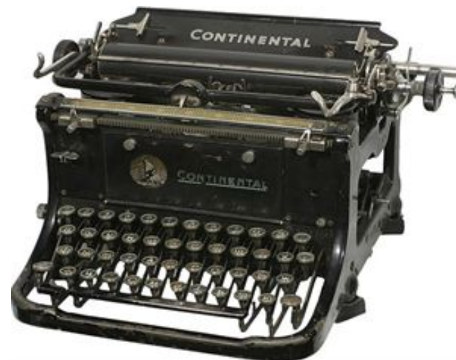
Пищуца машинка Continental