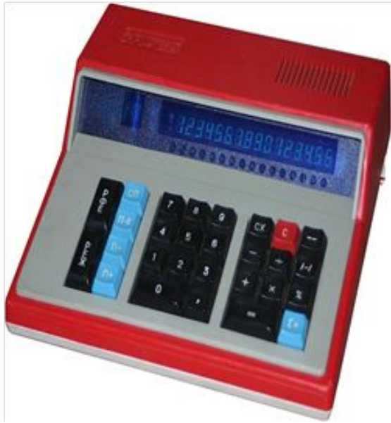
Радянський супернадійний калькулятор "Електроніка-МК59"