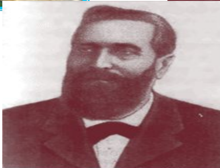
ЮГАН ФРІДРІХ ШЕР (1846 – 1924)