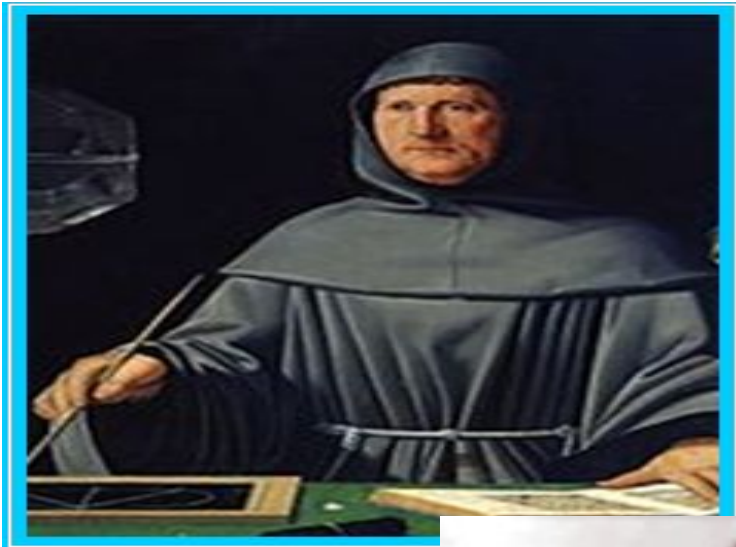
ЛУКА ПАЧОЛІ – (1445-1517)