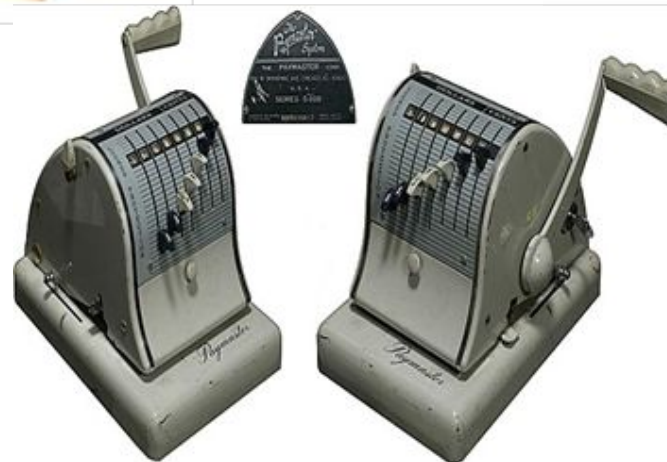
Касова машина "Paymaster S600"