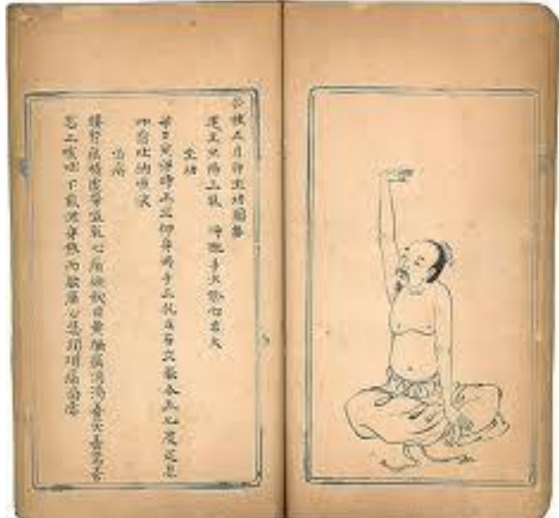
Woodblock prints containing traditional medical information and Daoist methods of cultivation, China, 170-180s.