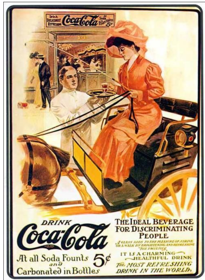
«Кока-Кола“ за 5 центов» — рекламные плакаты «Кока-Колы» периода 1890—1900 годов