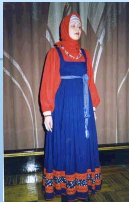
Традиционный русский синий сарафан.

Юбка как отдельный элемент одежды появилась достаточно поздно, в 18 веке. Необходимо отметить, что в различных областях России национальный костюм различен. В северной части России носили сарафан, а в южной части носили поверх рубахи поневу (seeliku taoline rõll). Цвет сарафана тоже имел значение. Красный сарафан шила мать дочери на свадьбу. Все предметы народного русского костюма всегда широкие и длинные.