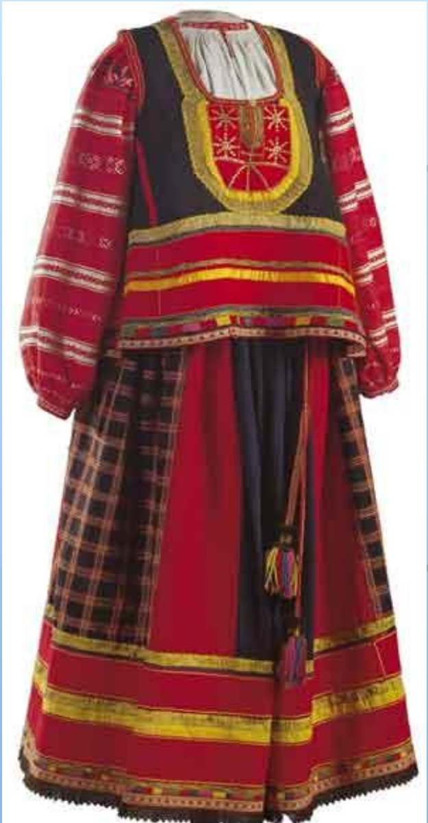
Рубаха, понева, навершник.