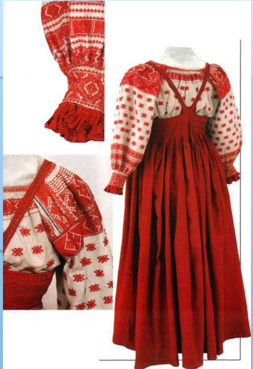
Рубаха и сарафан