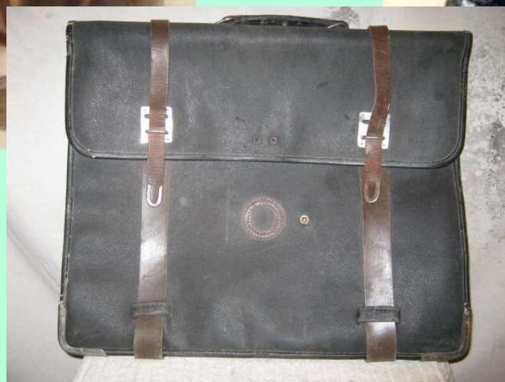
Портфель 50 -60 х годов