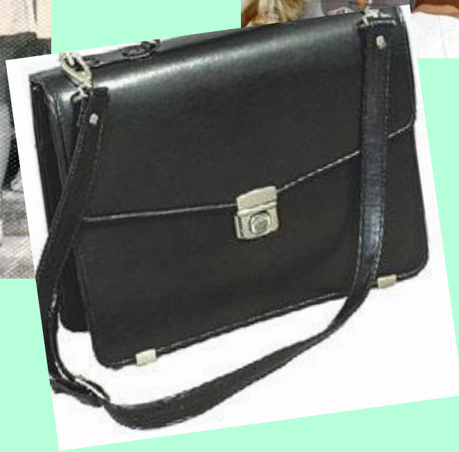
Портфель 70-х годов