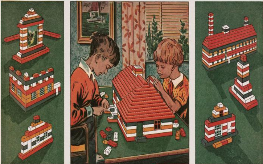
AUTOMATIC BINDING BRICKS