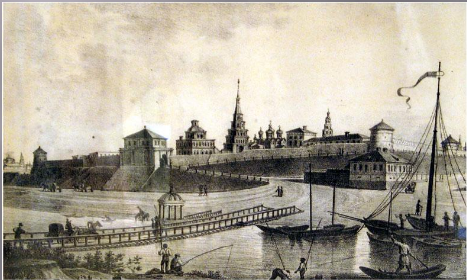
Вид Казанского кремля