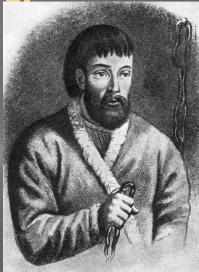
Пугачев Емельян Иванович