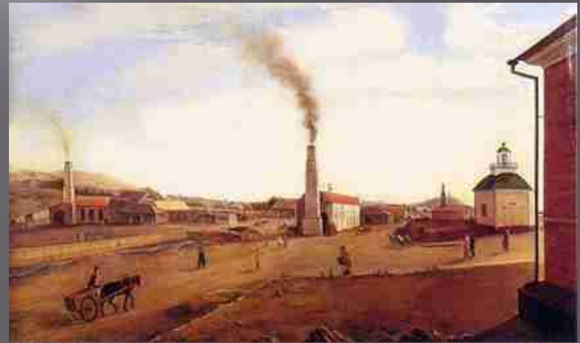
Уральский рудник. Картина демидовского крепостного художника В. П. Худоярова