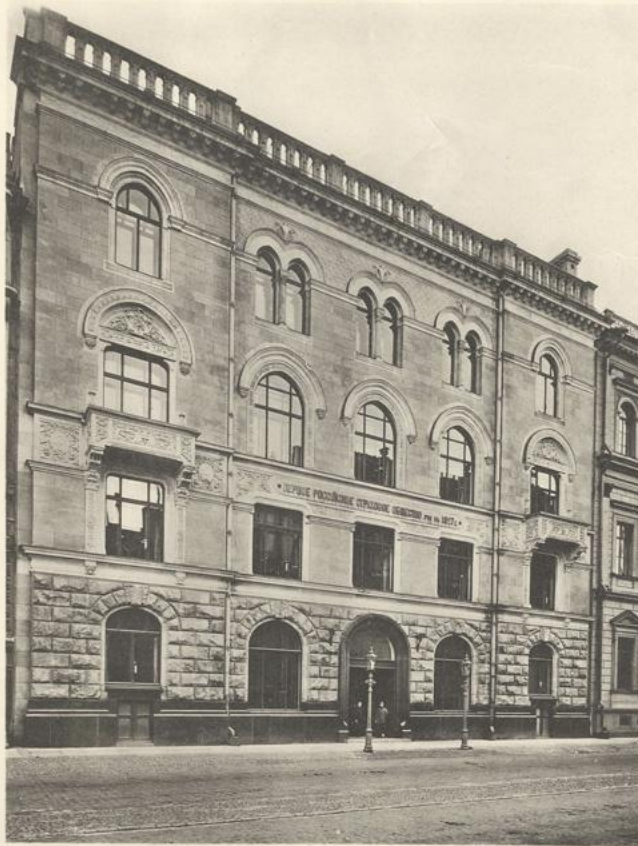
Домъ Перваго Россійскаго Страховаго Общества учр. въ 1827 г. С.-Петербургъ, Морская, 40. (построенъ въ 1898—1900 г.).