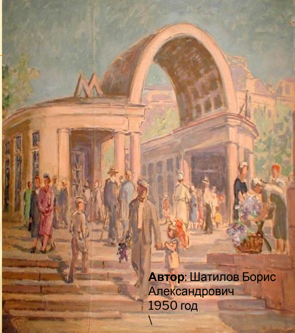
Автор: Шатилов Борис Александрович 1950 год