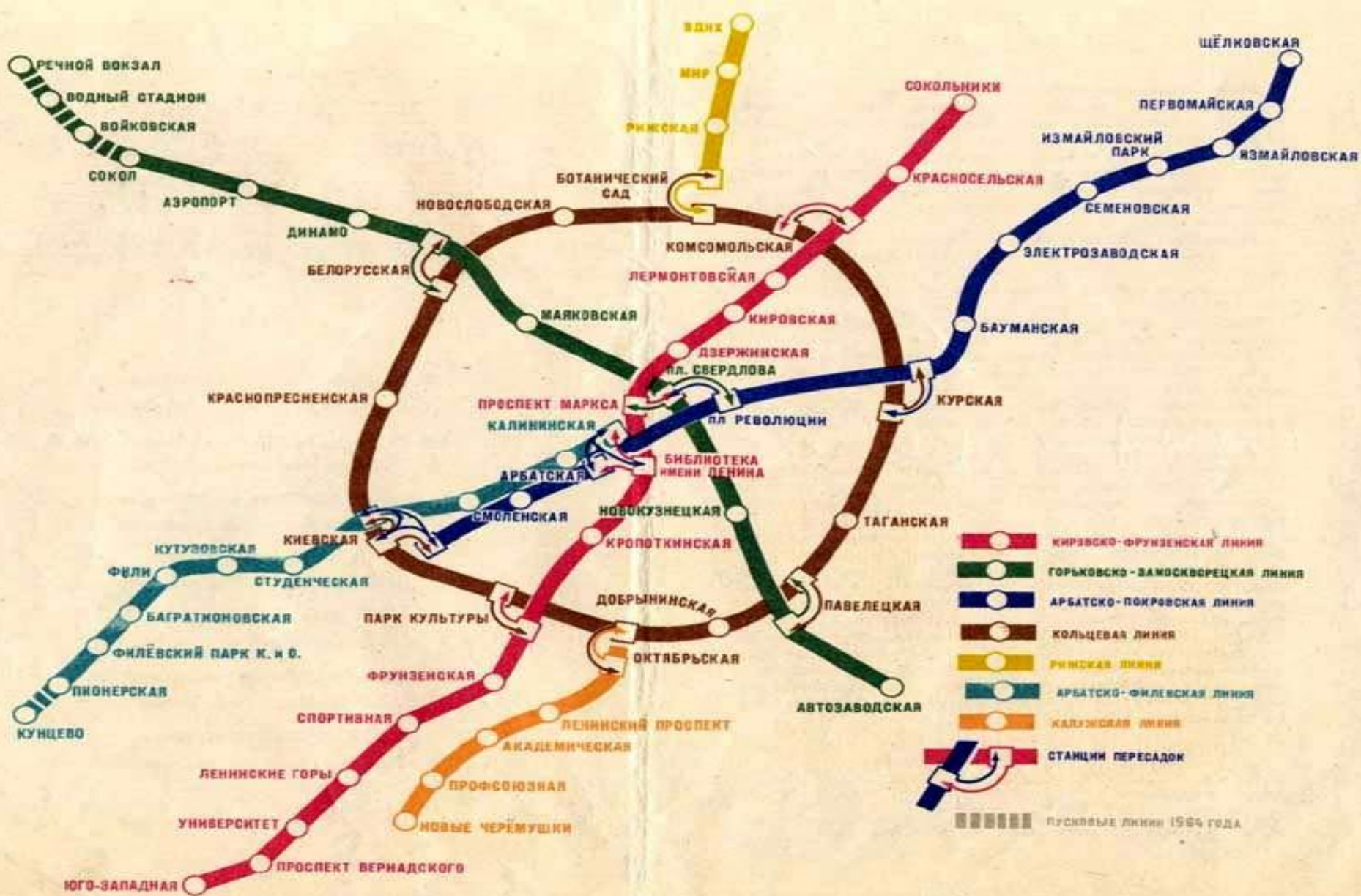
1964 г - 61 станций метро