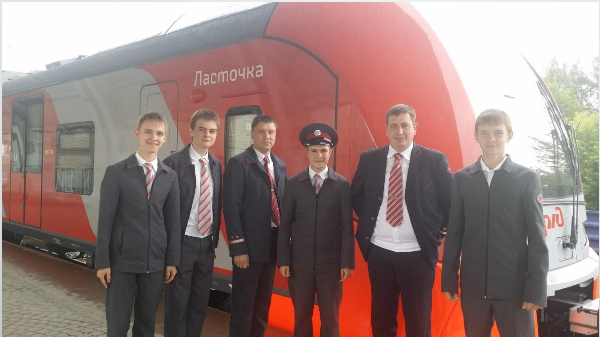
С локомотивной бригадой ЭС2Г на ст. «Аэропорт Кольцово» 9 июля 2015 года.