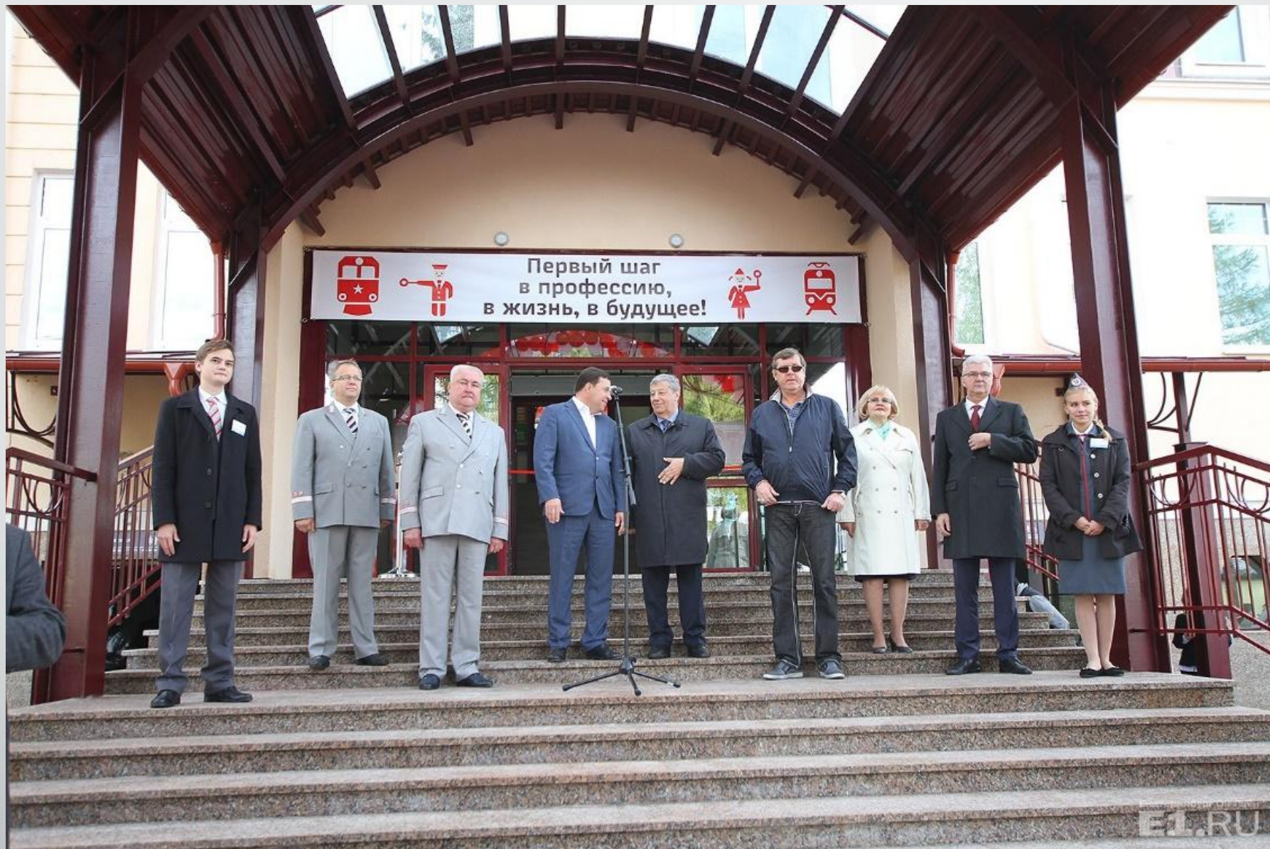
Открытие нового здания вокзала. 13 сентября 2016 года