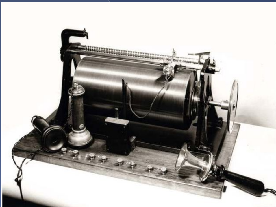
Телеграфон Поульсена – первая модель