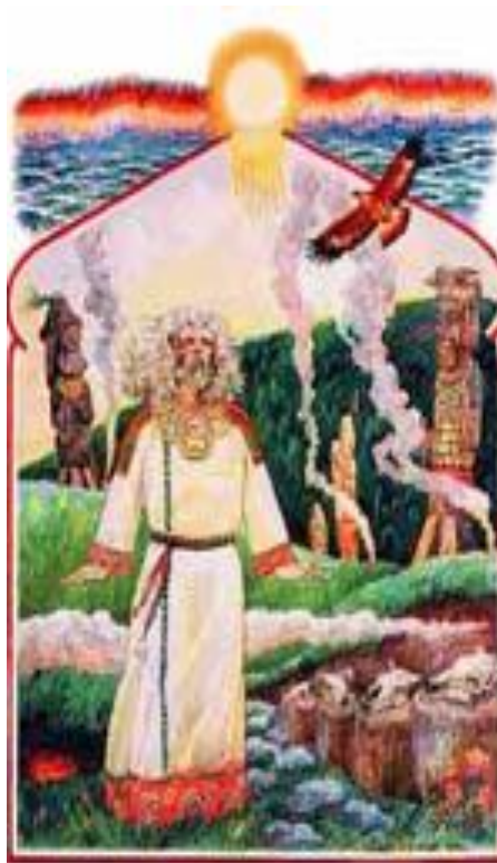
Хорс – бог солнца