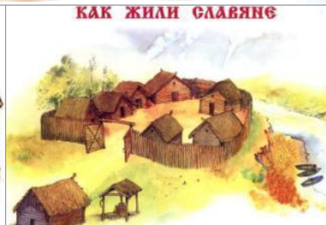
КАК ЖИЛИ СЛАВЯНЕ