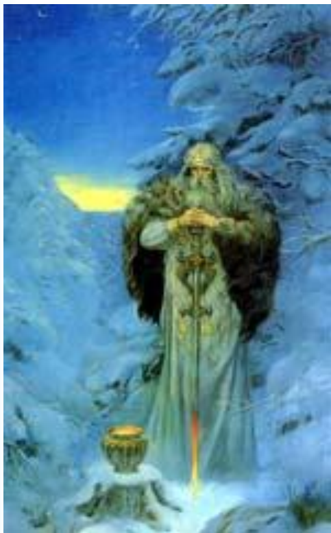
Сварог – бог огня