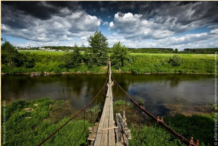
Подвесной мостик под Ивановским