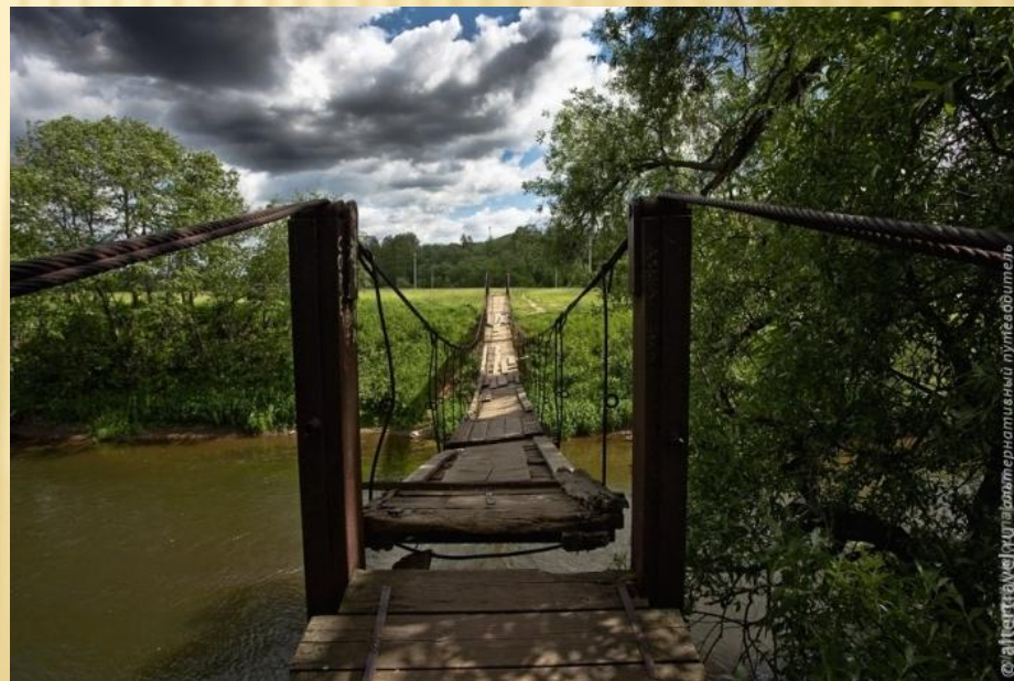
ШЕСТИСЕКЦИОННЫЙ ПОДВЕСНОЙ МОСТИК