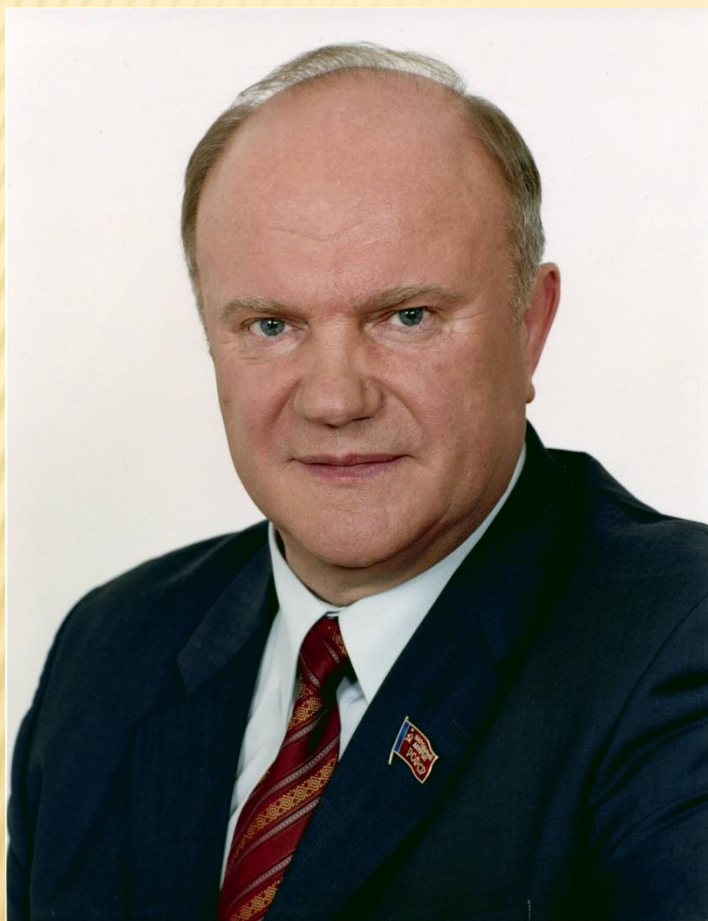
Лидер КПРФ Геннадий Зюганов