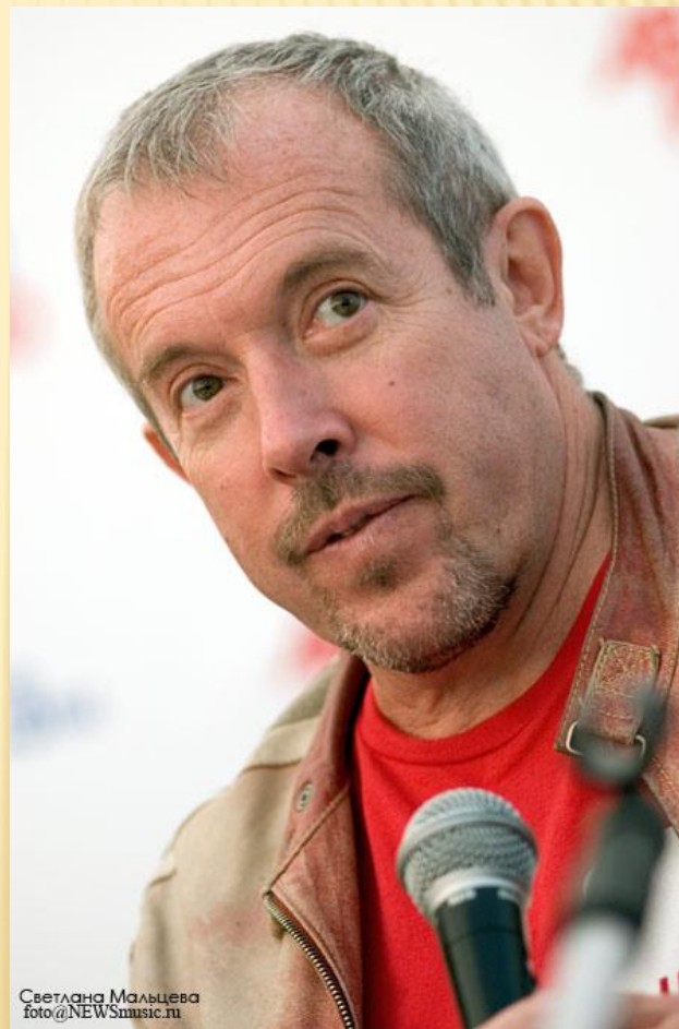
Музыкант Андрей Макаревич