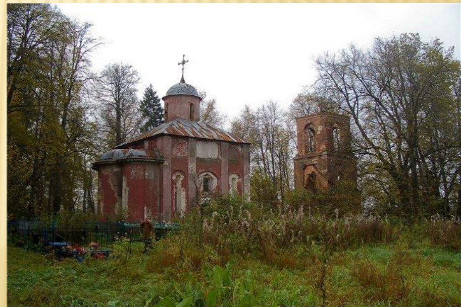
Церковь Рождества Христова в Юркино