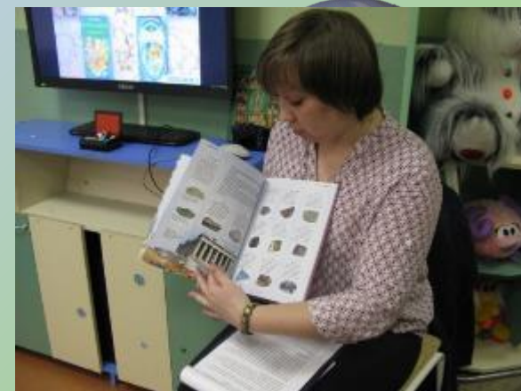
Рассказ - сообщение «Поделочные камни Урала»