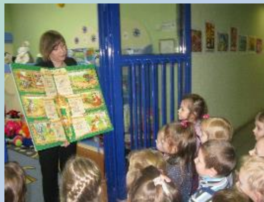
Беседа «Книги бывают разные»