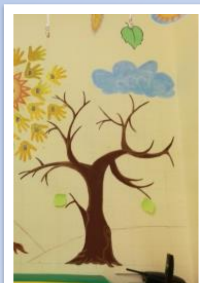
Традиция группы: «Книжное дерево»

На «книжном» дереве появляются листочки, на которых родители записывают название книг, прочитавших с ребенком дома.