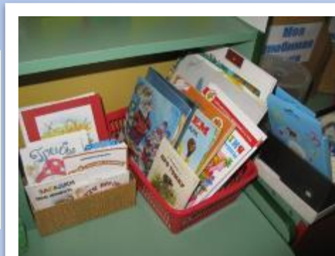
Традиция группы: «Книга напрокат» (в раздевалке) – обмен книгами