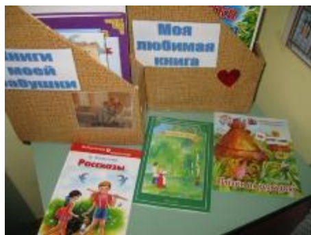
Библиотечка «Книги наших бабушек»