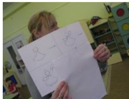
Рисование «Огневушка-поскакушка» (проводит мама Вероники К.