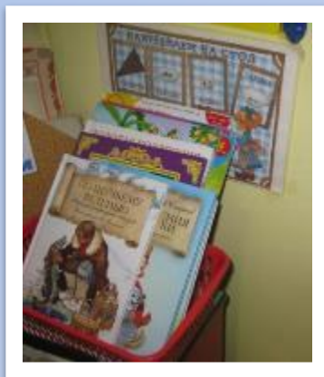
Акция «Подари книгу группе»