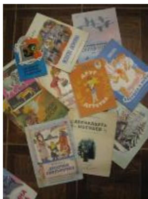
Любимые книги детей