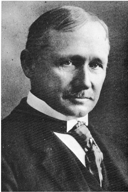
Фредерик Уинслоу Тейлор Основатель научного менеджмента 1856-1915