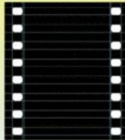
фотоплёнки и киноплёнку