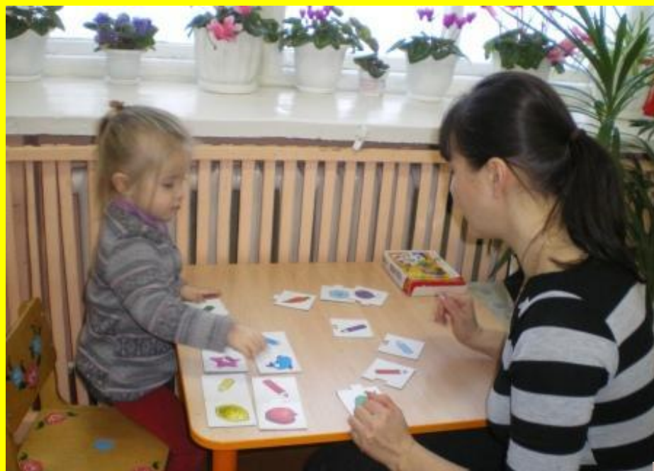
Д/и «Воздушные шары»