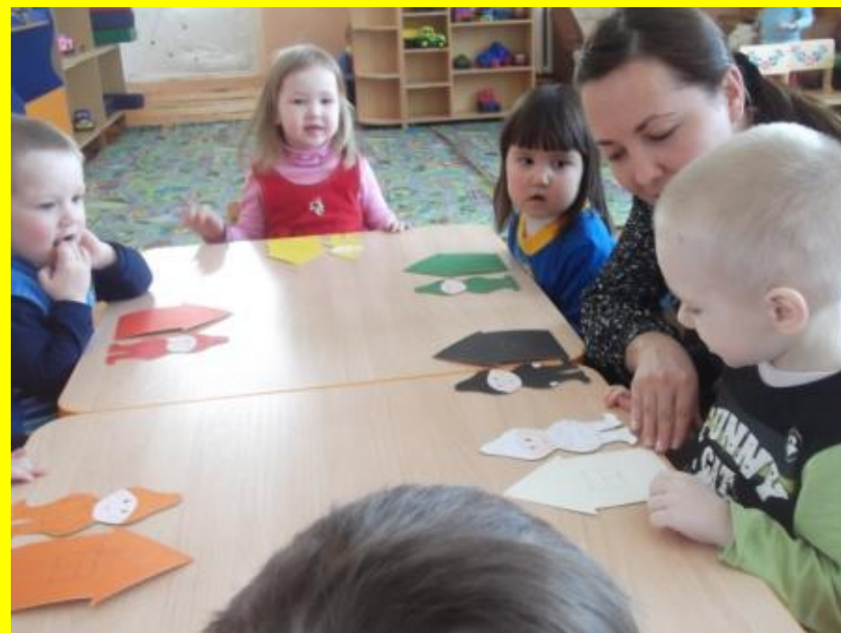
Д/и «Домики для гномиков»