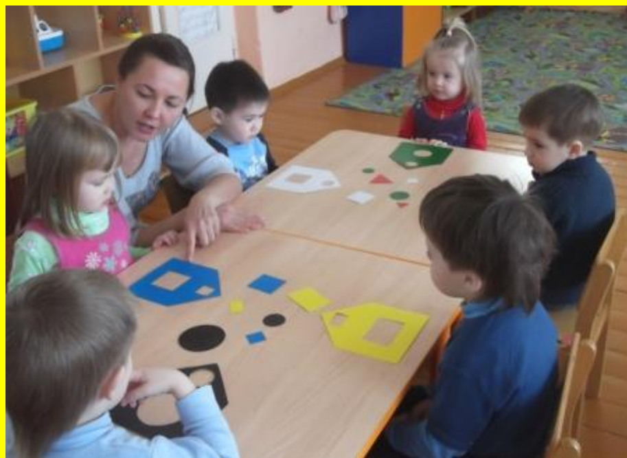
Д/и «Найди окошко домику»