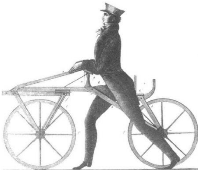
Laufmaschine des Freiherrn von Drais (erfunden 1817)

ПЕРВЫМ УСТРОЙСТВО, ПОХОЖЕЕ НА ВЕЛОСИПЕД, СОЗДАЛ В 1817-М ГОДУ НЕМЕЦКИЙ ПРОФЕССОР БАРОН КАРЛ ФОН ДРЕЗ.