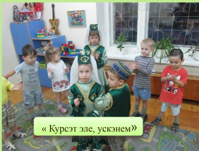
«Курсэт эле, ускэнем»

Игра является эффективной и доступной формой деятельности при обучении русских детей татарской устной речи. Дети даже не задумываются, что они учатся, сами того не замечая, намного лучше усваивают татарские слова, фразы, предложения и на этой основе у них отрабатывается правильное произношение специфических татарских звуков.