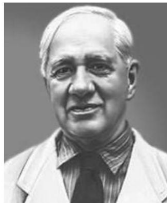
Корней Иванович Чуковский

С юношеских лет вел трудовую жизнь, много читал, изучил самостоятельно английский и французский языки. В 1901 начал печататься в газете "Одесские новости", в качестве корреспондента которой был в 1903 направлен в Лондон. Целый год жил в Англии, изучал английскую литературу, писал о ней в русской печати. После возвращения поселился в Петербурге, занялся литературной критикой, сотрудничал в журнале "Весы".