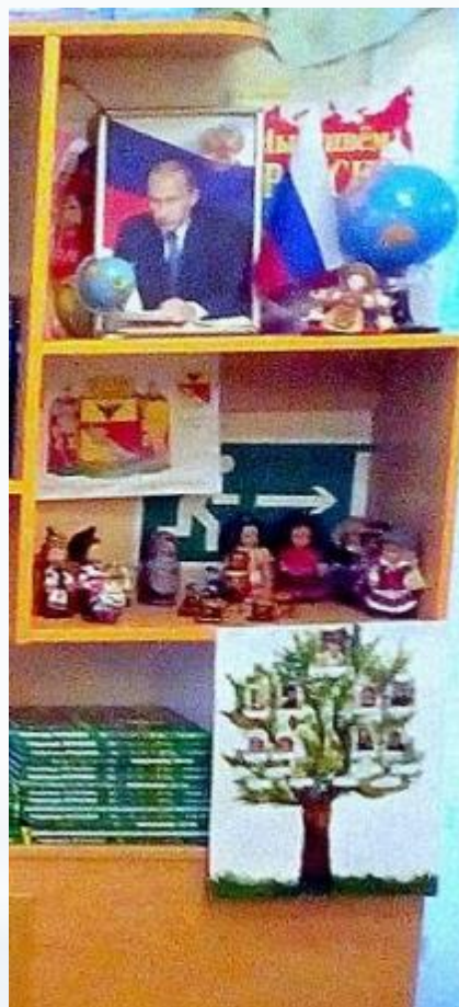
Рабочий сектор (Модуль гендерного и патриотического воспитания)