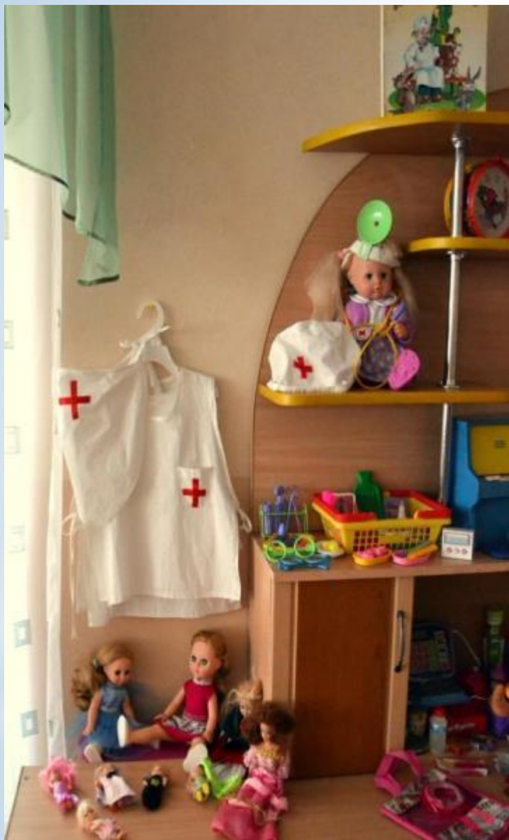
Активный сектор - игры для девочек ( модуль Поликлиника)