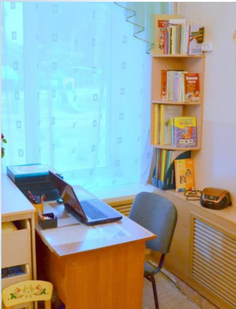
Рабочий сектор (методическая литература педагога и ИКТ для педагога)