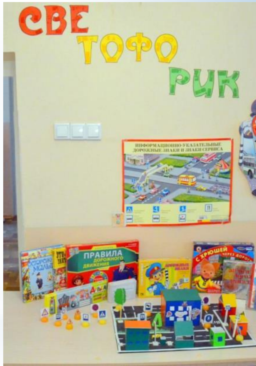
Рабочий сектор (модуль безопасного поведения на дороге)