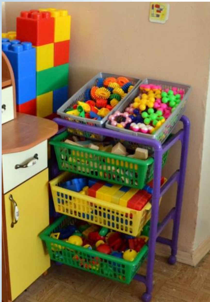
Рабочий сектор (модуль Сенсорика - Конструирование)