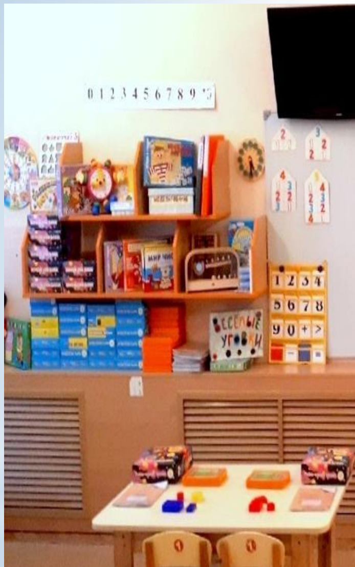
Рабочий сектор (Модуль математического развития)