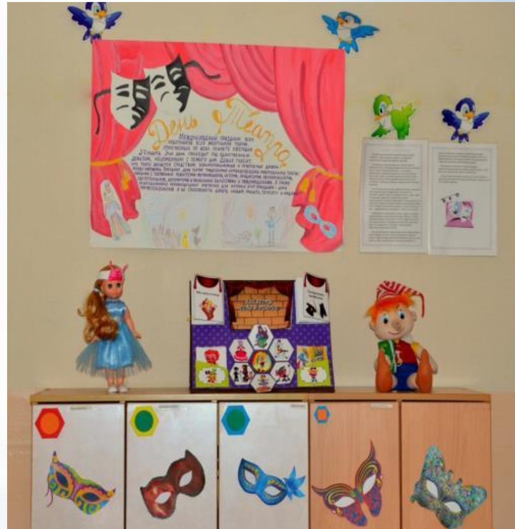
Среда для диалога с родителями (Центр - консультационный: консультации для родителей «Как организовать выходной день с ребенком» «Правила поведения в театре»)