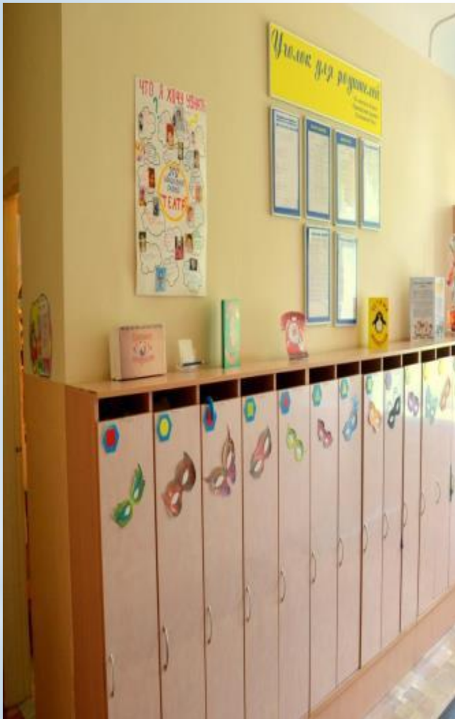
Среда для диалога с родителями (Центр - информационный )