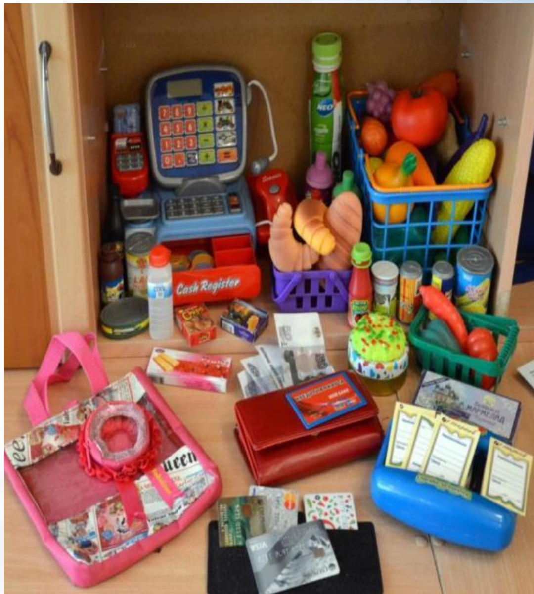
Активный сектор - игры для девочек (модуль Магазин)