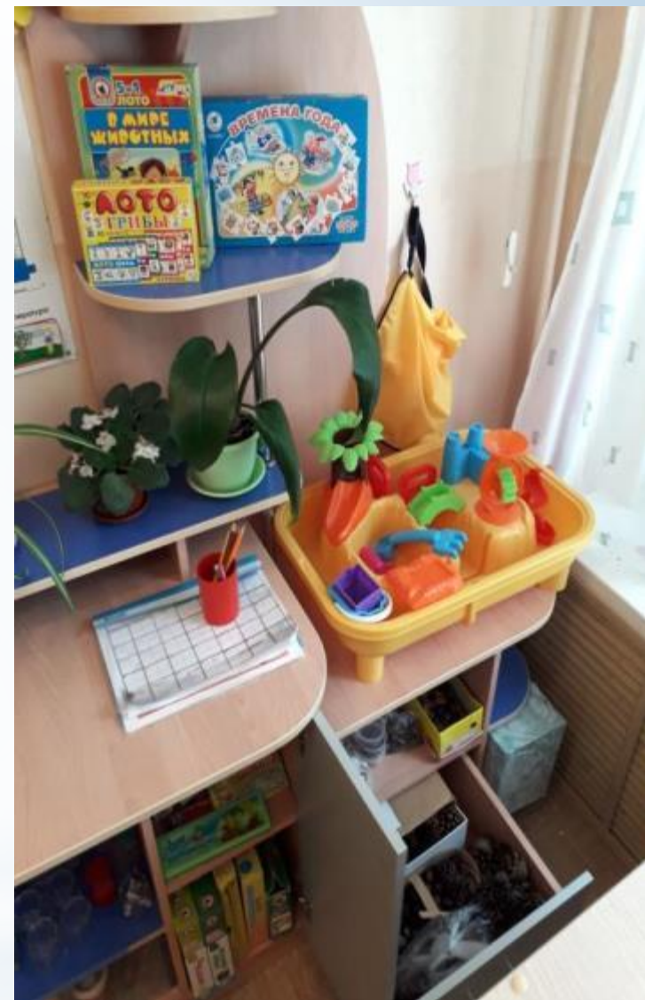
Модуль «Исследований и экспериментирования» , и «Социокультурные ценности»