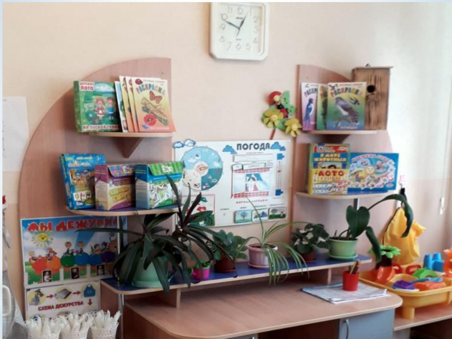
Модуль «Живая природа» и «Неживая природа»