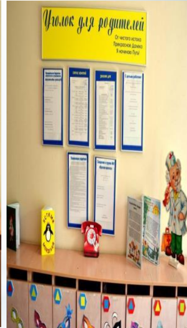
Среда для диалога с родителями (Центр - информационный: информация о ДОО , режиме дня, график работы специалистов и администрации )