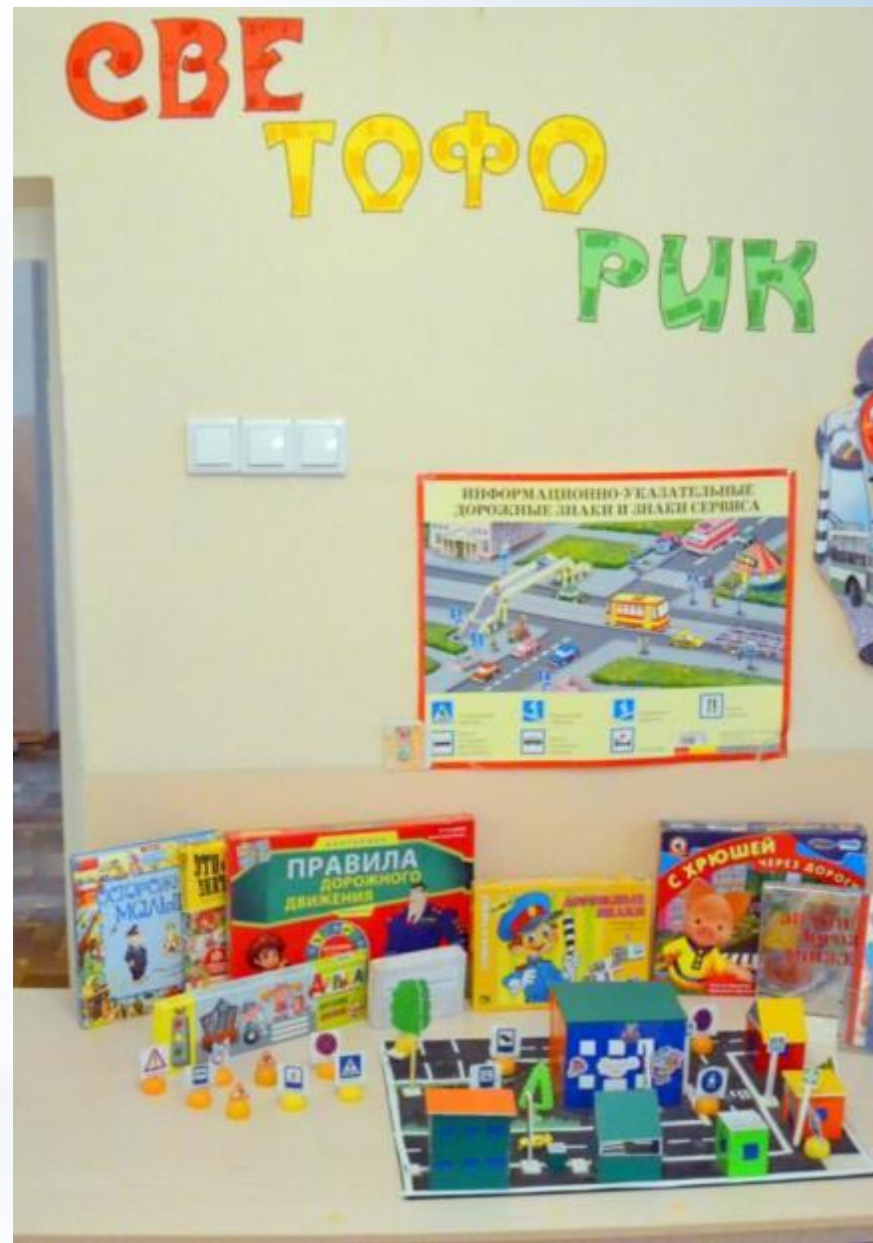
Рабочий сектор (модуль безопасного поведения на дороге)