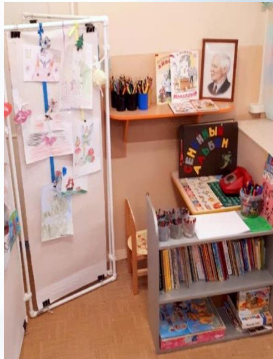
Спокойный сектор ( Центр продуктивной деятельности, Центр литературы, Центр уединения)