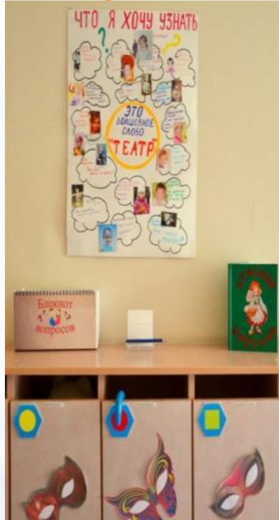
Среда для диалога с родителями (Центр - информационный : обратная связь )