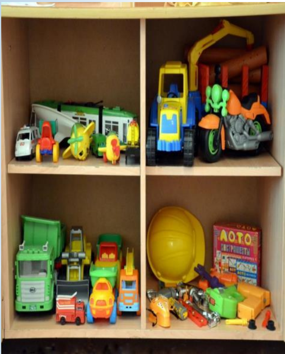
Активный сектор - игры для мальчиков (модуль автопарковка, модуль автомастерские)