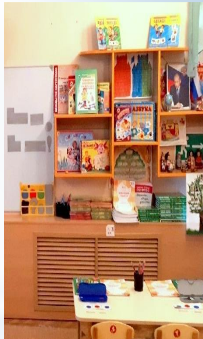
Рабочий сектор (Модуль освоения родного языка)