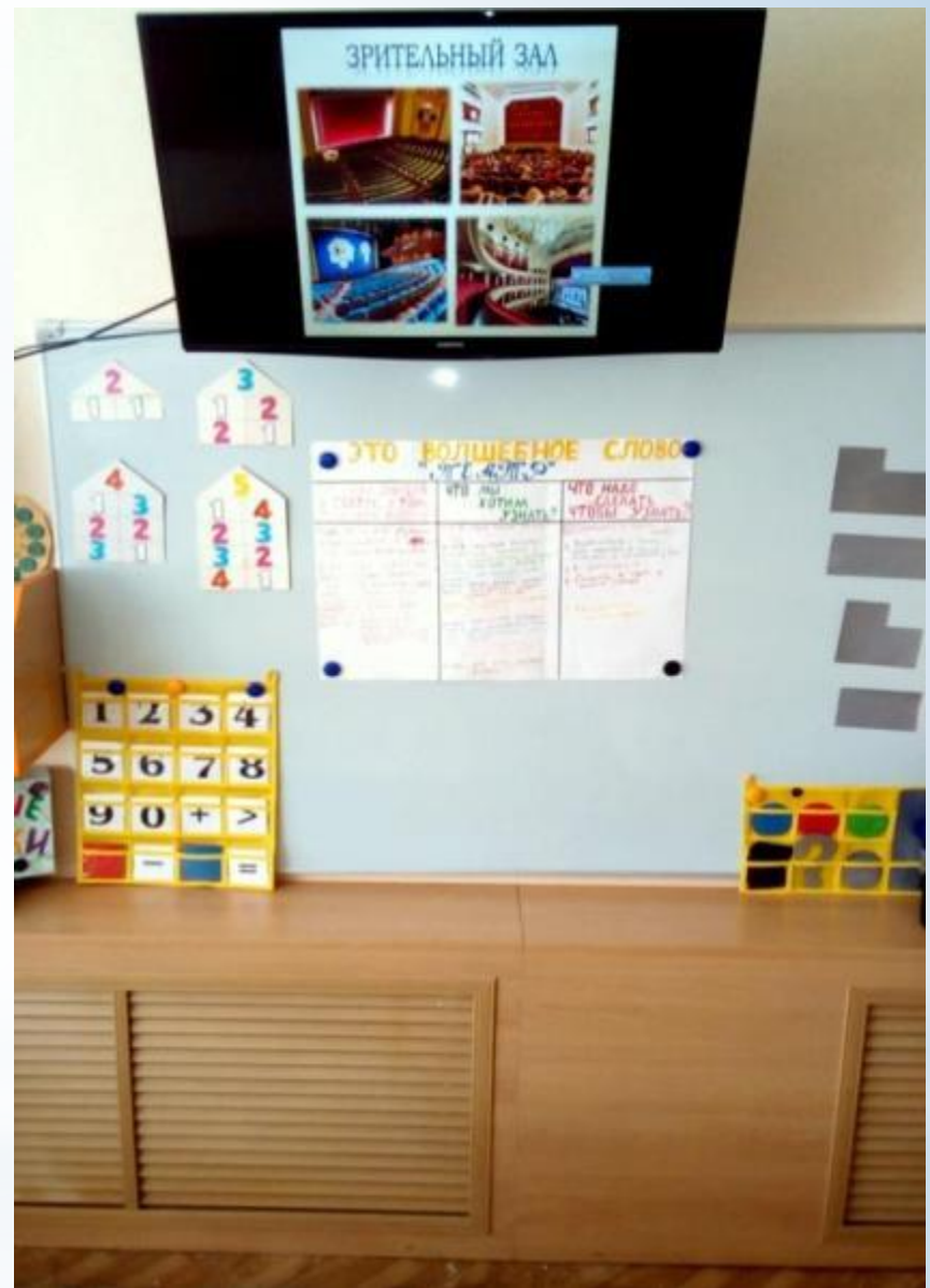
Рабочий сектор (ИКТ для педагога и детей)