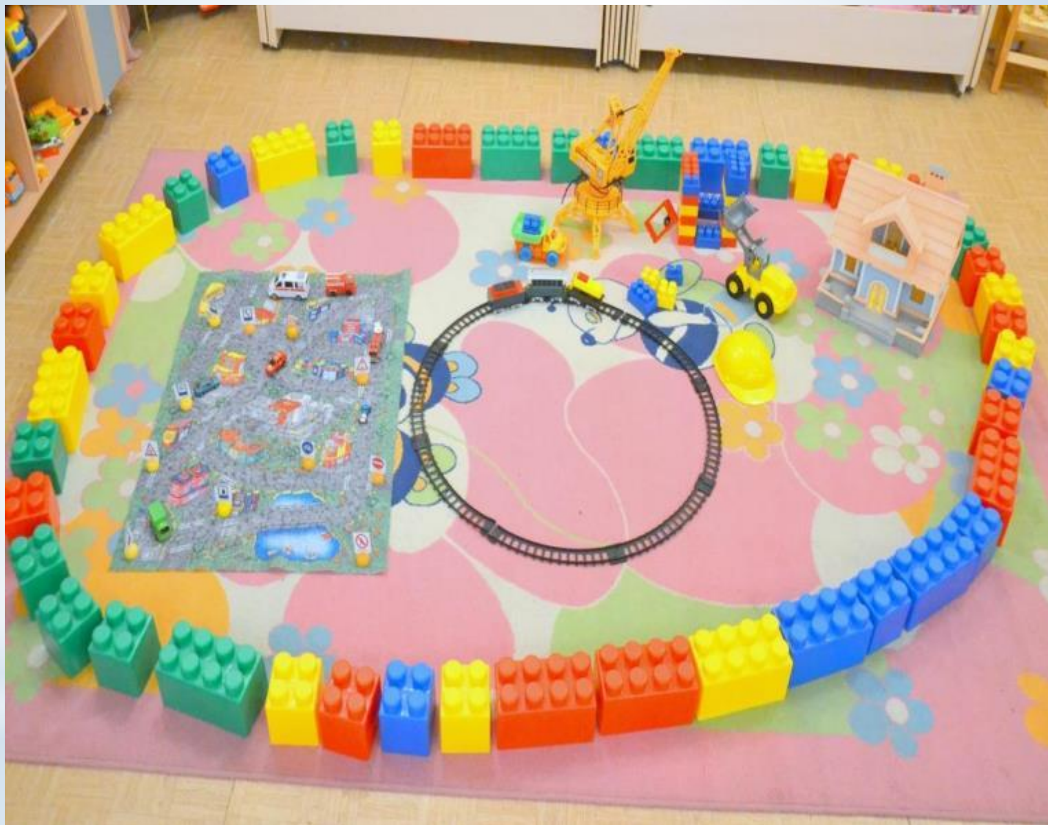
Активный сектор - игры для мальчиков (модуль Автопарковка, модуль Железная дорога, модуль Строительство дома)