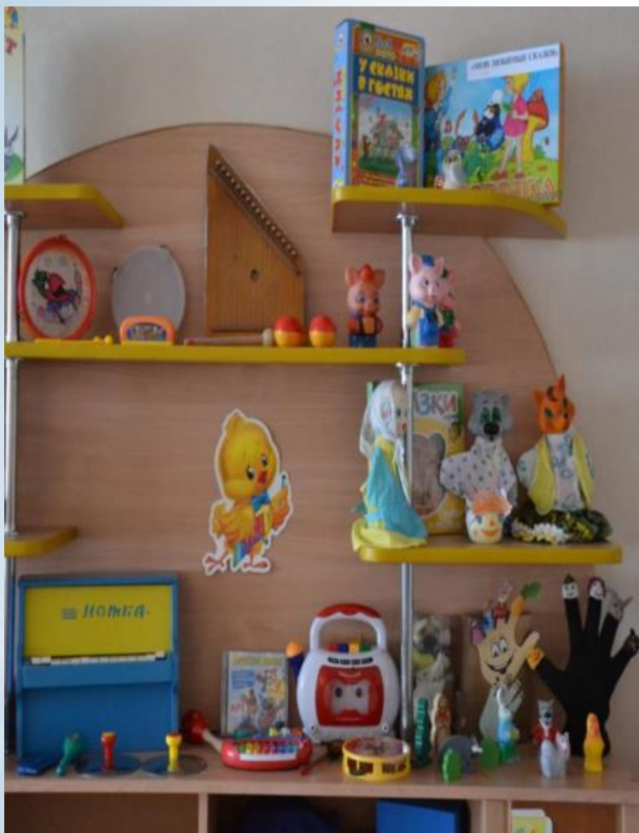
Активный сектор (Центр музыкально-театрализованной деятельности - модуль музыкальная деятельность)