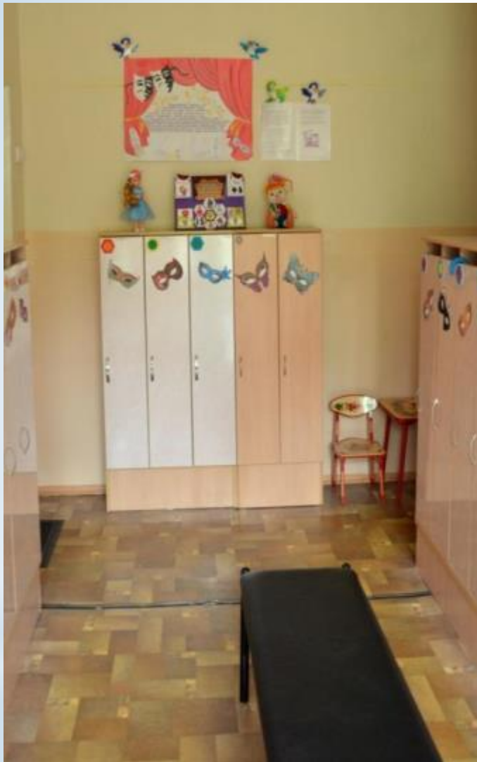
Среда для диалога с родителями (Центр - консультационный )