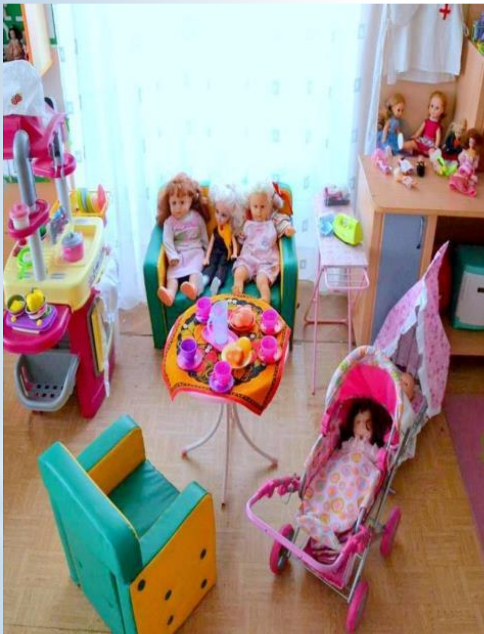
Активный сектор - игры для девочек (модуль кухня, модуль семья )