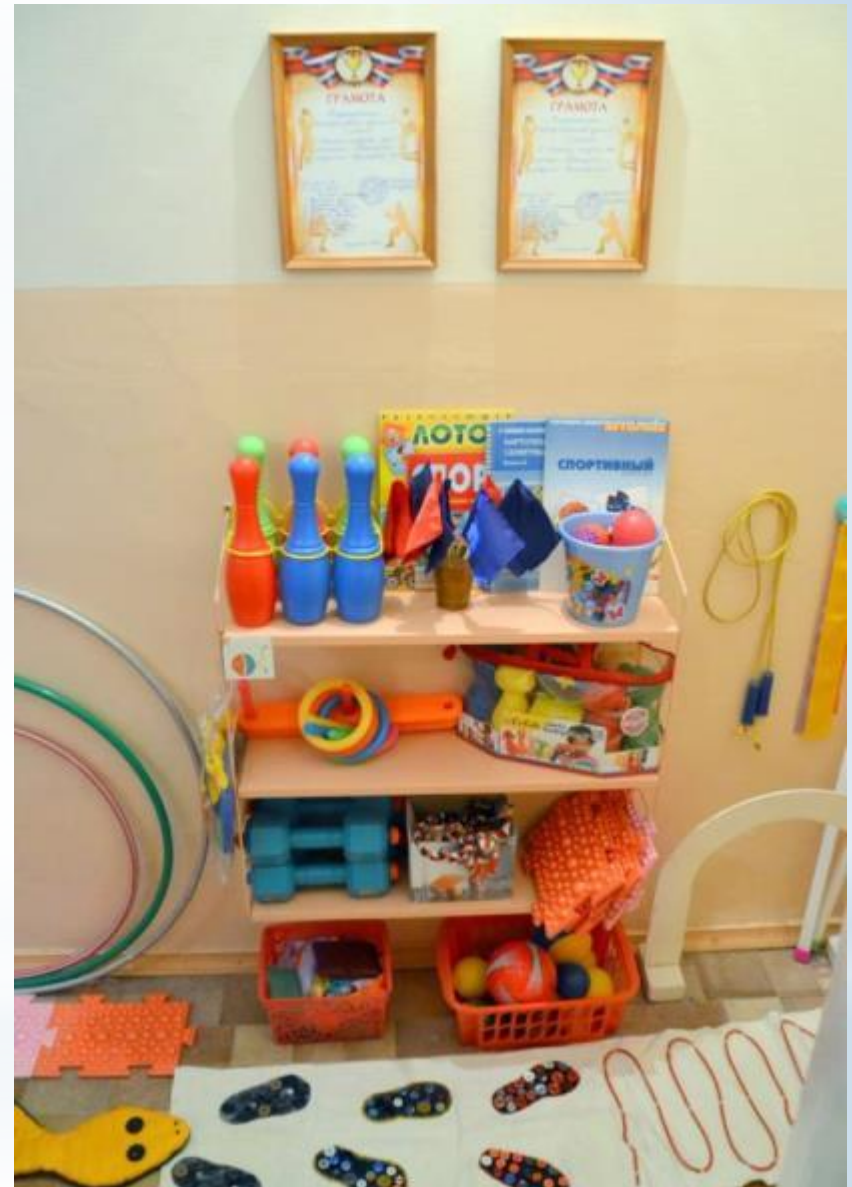
Активный сектор (Центр двигательной активности)