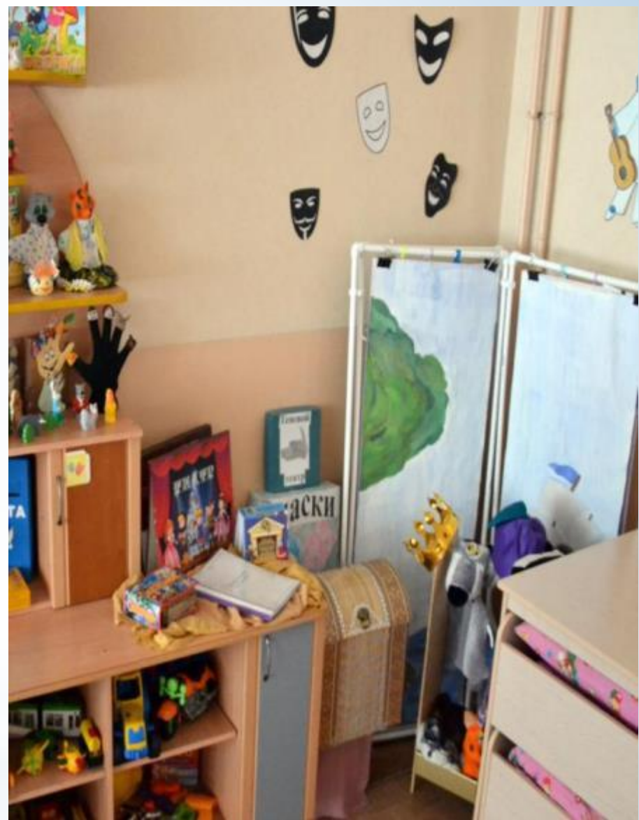
Активный сектор (Центр музыкально-театрализованной деятельности - модуль театрализованная деятельность)