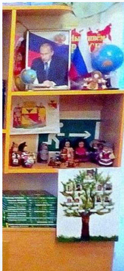
Рабочий сектор (Модуль гендерного и патриотического воспитания)