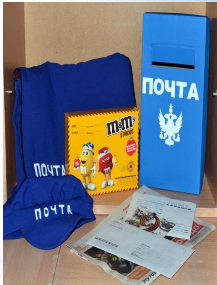
Активный сектор - игры для мальчиков (модуль Почта)