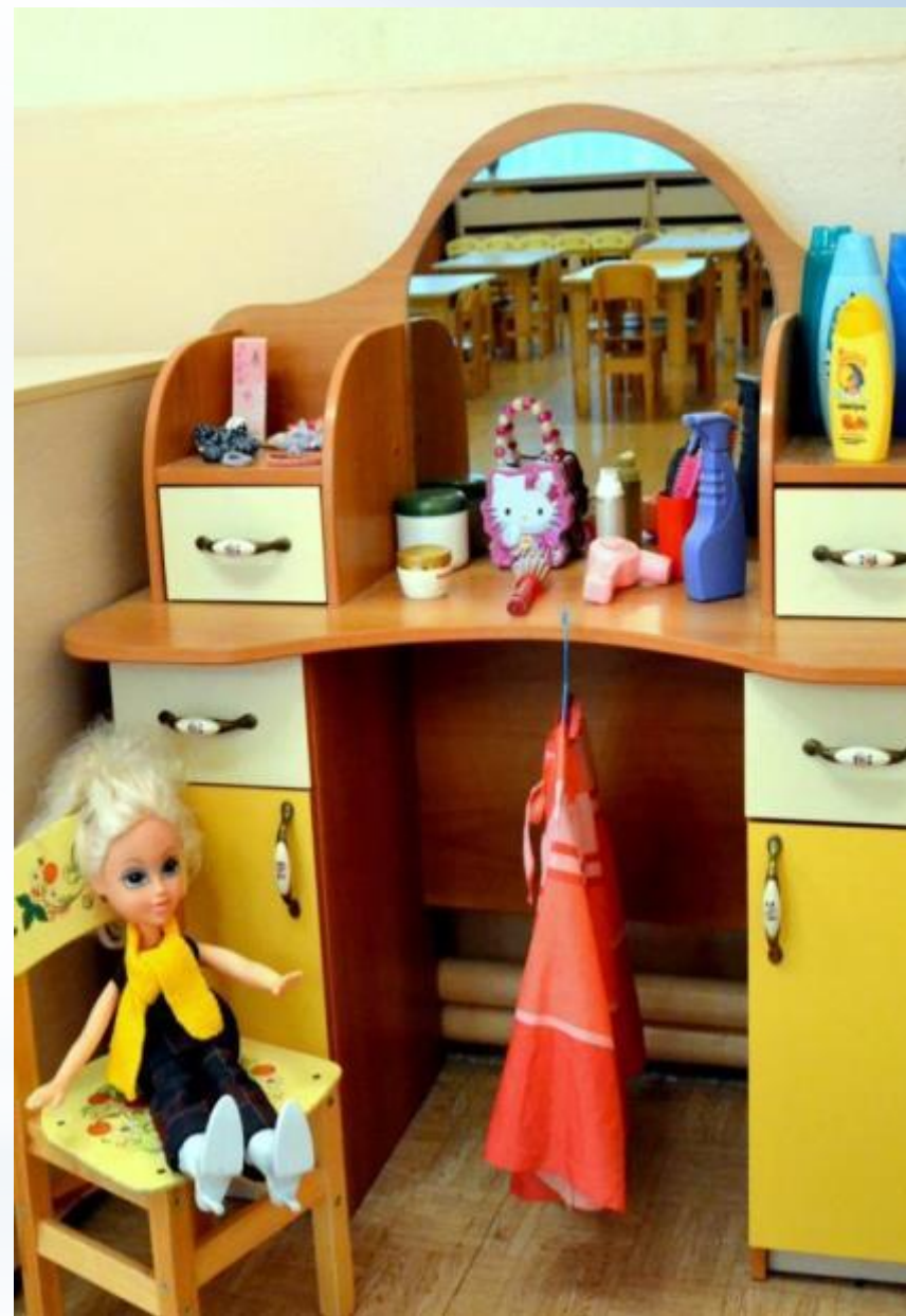
Активный сектор - игры для девочек (модуль Парикмахерская)