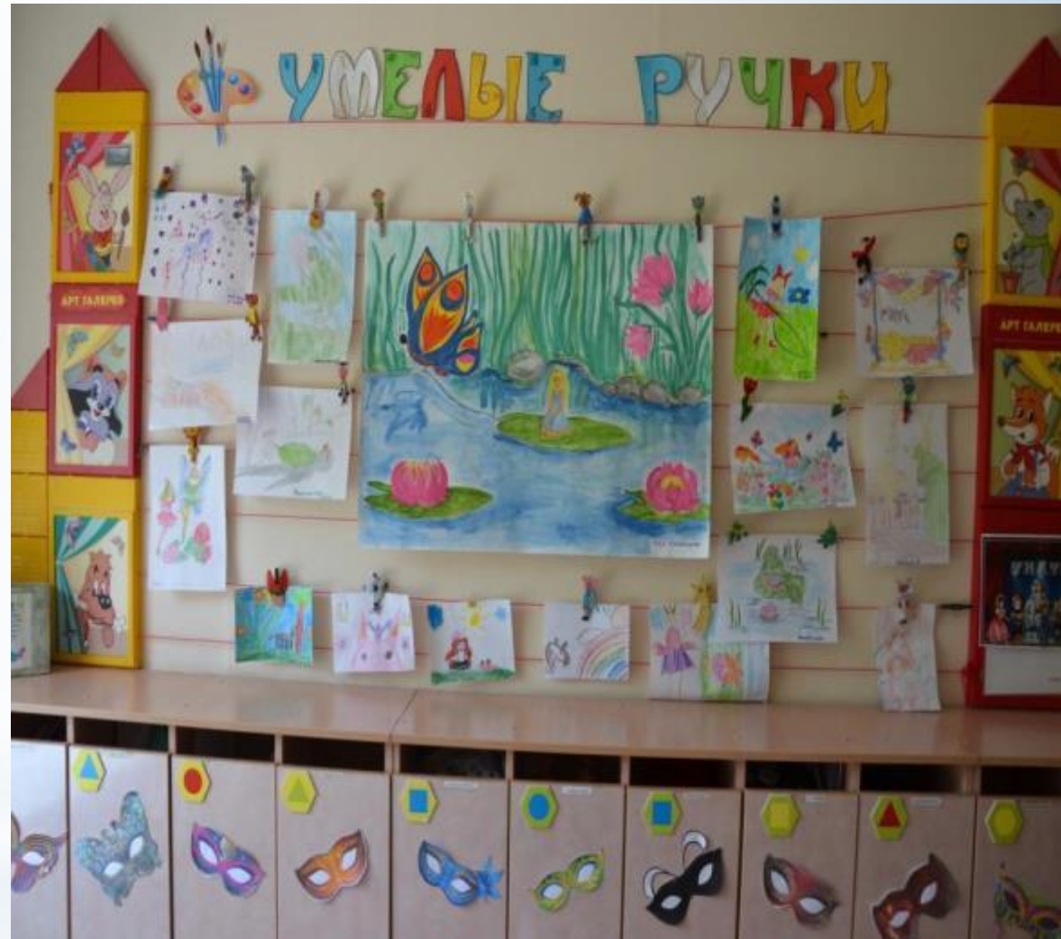
Среда для диалога с родителями (Центр - практический)