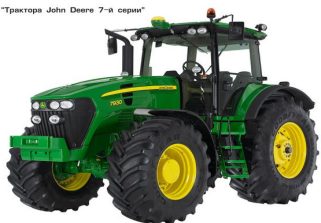
"Тракторы John Deere 7-й серии"