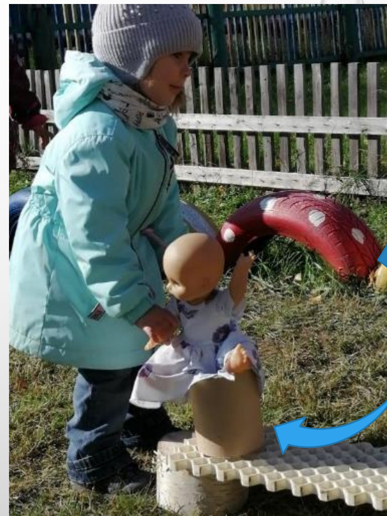
Машенька садит дочку на горшочек.