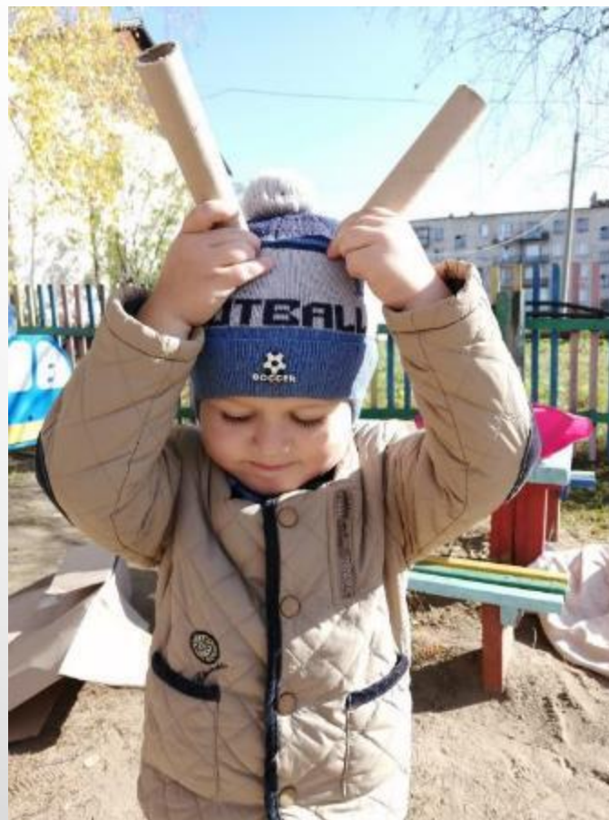
20 сентября. Вечерняя прогулка. Тема превращается в зайку.