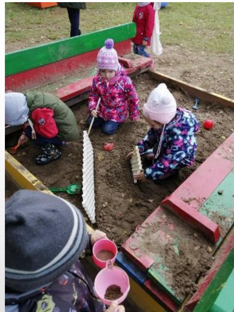
Ариша, после прочтения сказки о сереньком козликe, делает для него ограждение. Ей очень не понравился конец сказки.