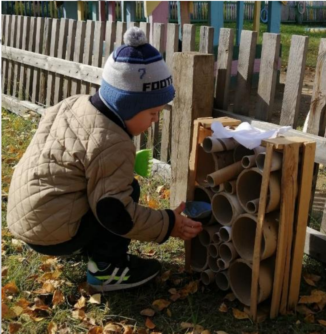
26 сентября. Вечерняя прогулка. Тема использовал трубы, как полочку под инструментов.