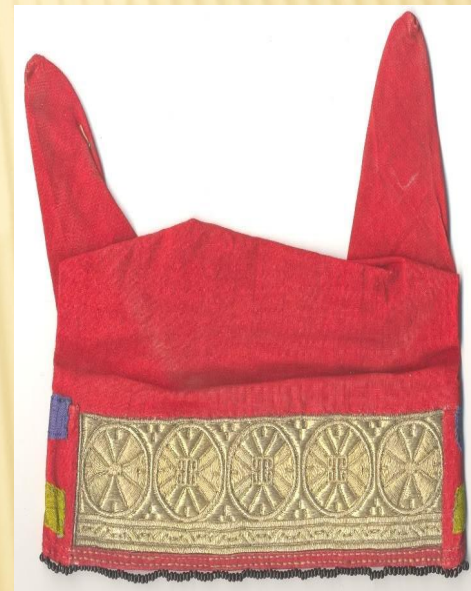
КИЧКА ИЛИ СОРОКА