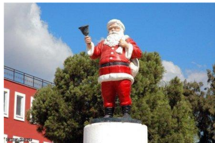
• • • Статуя Санта Клауса

В Вильмингтоне (Wilmington; штат Нью-Йорк) у Белойлицей горы (Whiteface Mountain) построен дом, в котором Санта Клаус живет постоянно. В распоряжении Санты находится кузнец, помогающий ему подковывать оленя, часовня и почта. Ежегодно домик Санта Клауса посещают более 100 000 человек. Более трех миллионов писем, адресованных Санте, приходят в городок Санта Клаус, где находится статуя американского Деда Мороза высотой почти в восемь метров.