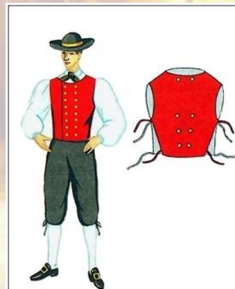
А. Костюм поволжского немца-колониста. Конец XVIII - начало XIX веков. Реконструкция.