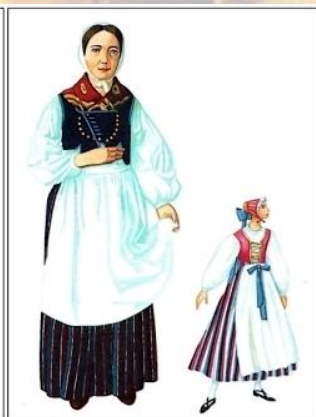
Б. Варианты костюмов поволжской немки. Начало XIX века. Реконструкция.