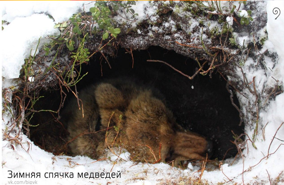
Зимняя спячка медведей