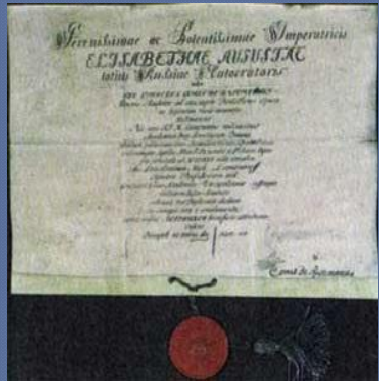
Диплом на звание профессора химии

Одним из первых важных начинаний химика явилась постройка в 1748 г. химической лаборатории Академии наук на Васильевском острове. Она стала первым в истории России исследовательским учреждением.