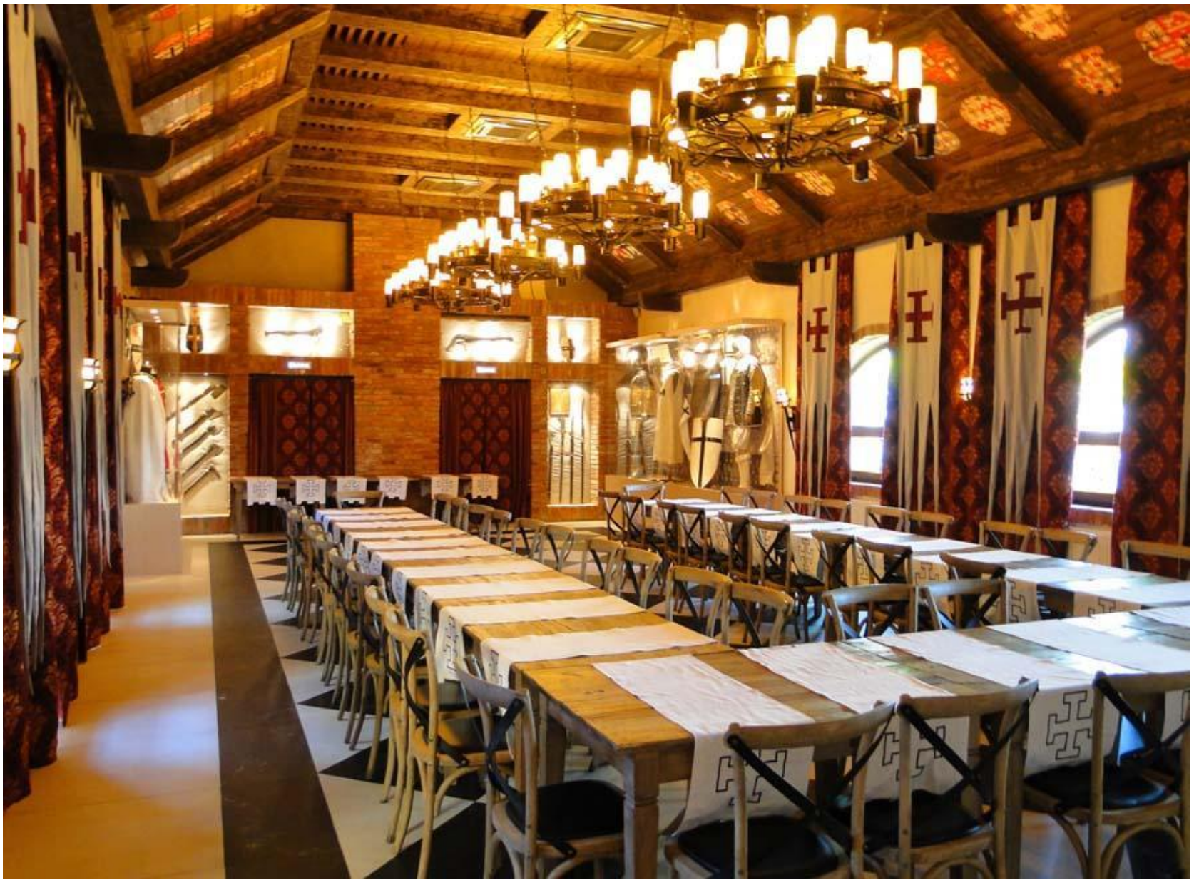
Замок – отель Нессельбек