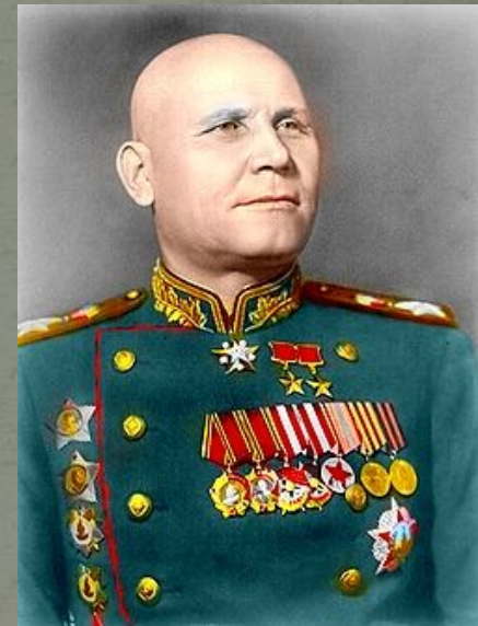
Генерал-полковник Иван Степанович Конеv, командир Калининского фронта