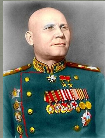
Генерал-полковник Иван Степанович Конеv, командир Калининского фронта