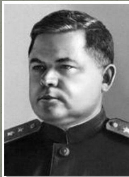
Генерал армии Николай Фёдорович Ватутин, командир оперативной группы войск Северо- Западного фронта