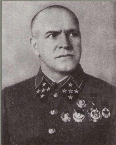
Генерал армии Георгий Константинович Жуков, командующий Западным фронтом