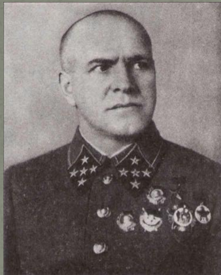
Генерал армии Георгий Константинович Жуков, командующий Западным фронтом