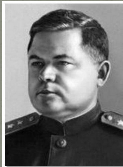
Генерал армии Николай Фёдорович Ватутин, командир оперативной группы войск Северо- Западного фронта