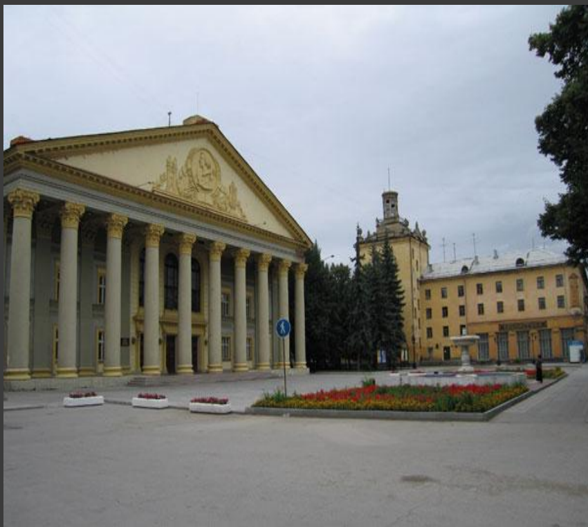
ДК им. Горького