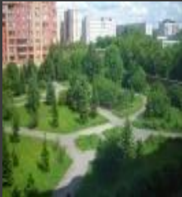
ПКиО "Сосновый бор"