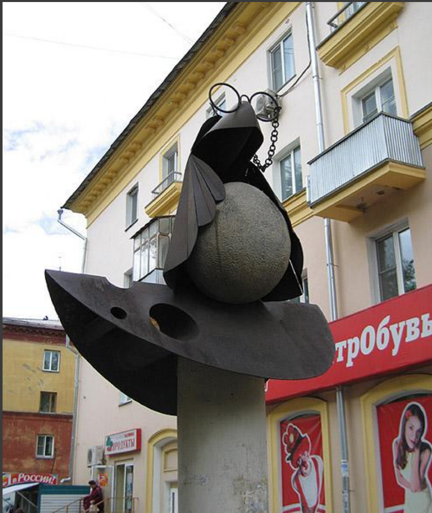
« Ворона с сыром »