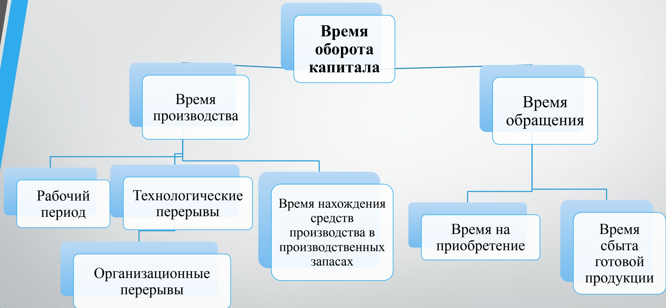
Рис.6 Структура времени оборота капитала