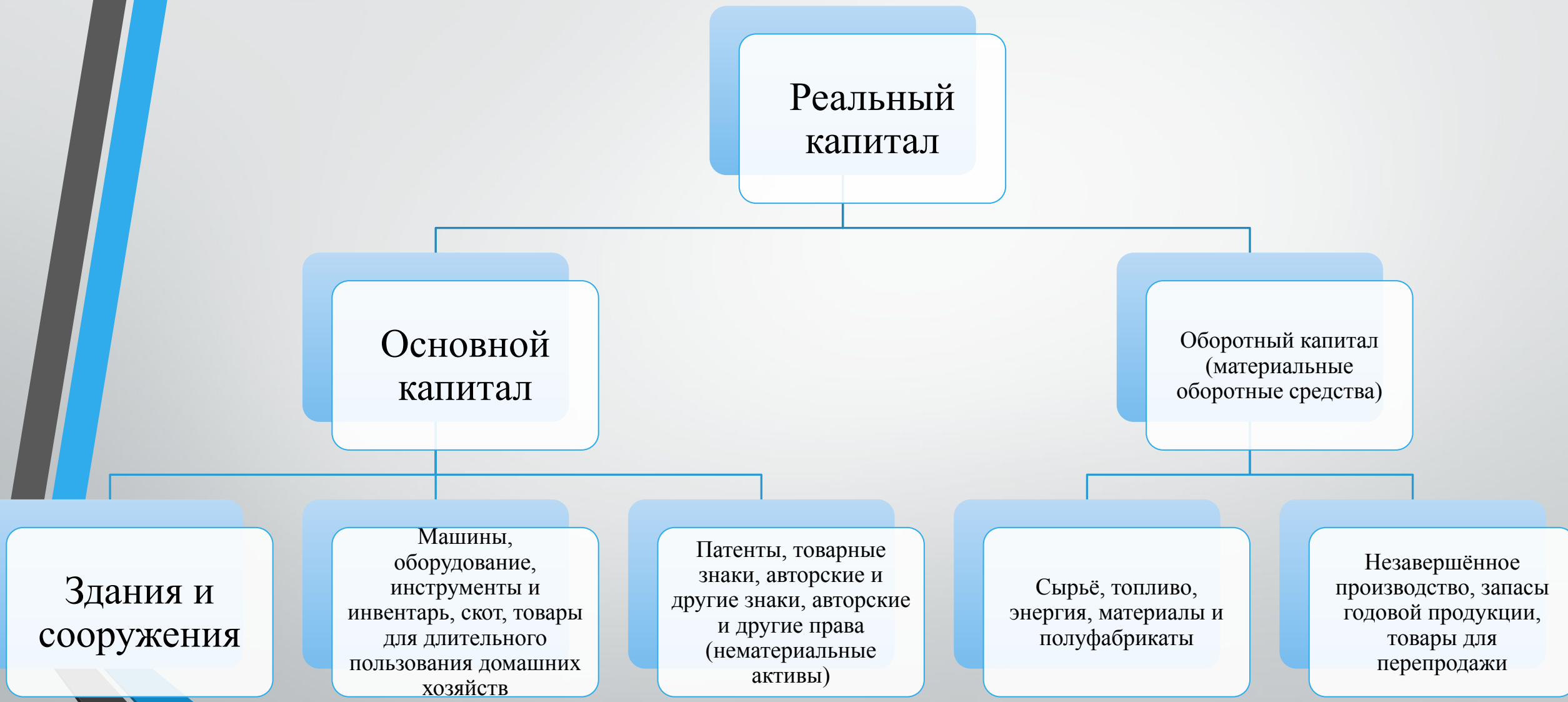
Рис.2 Реальный капитал