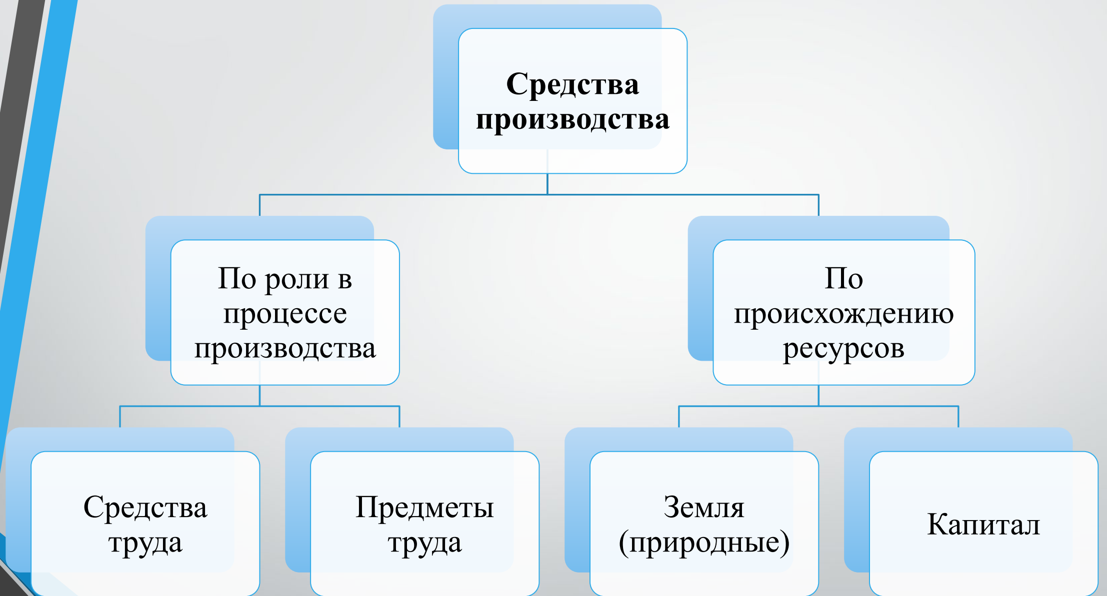
Рис.4 Средства производства