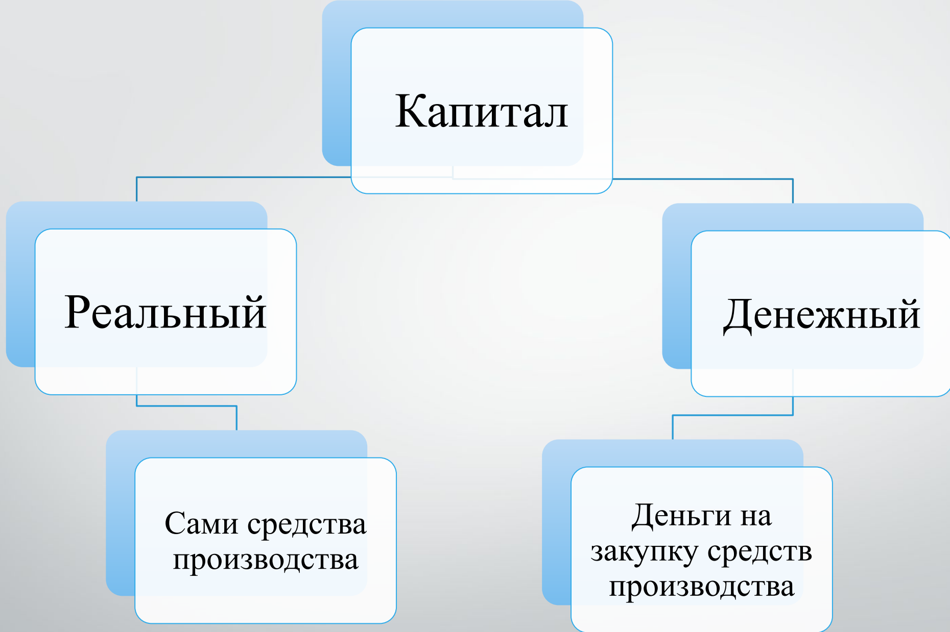
Рис.1 Виды капитала