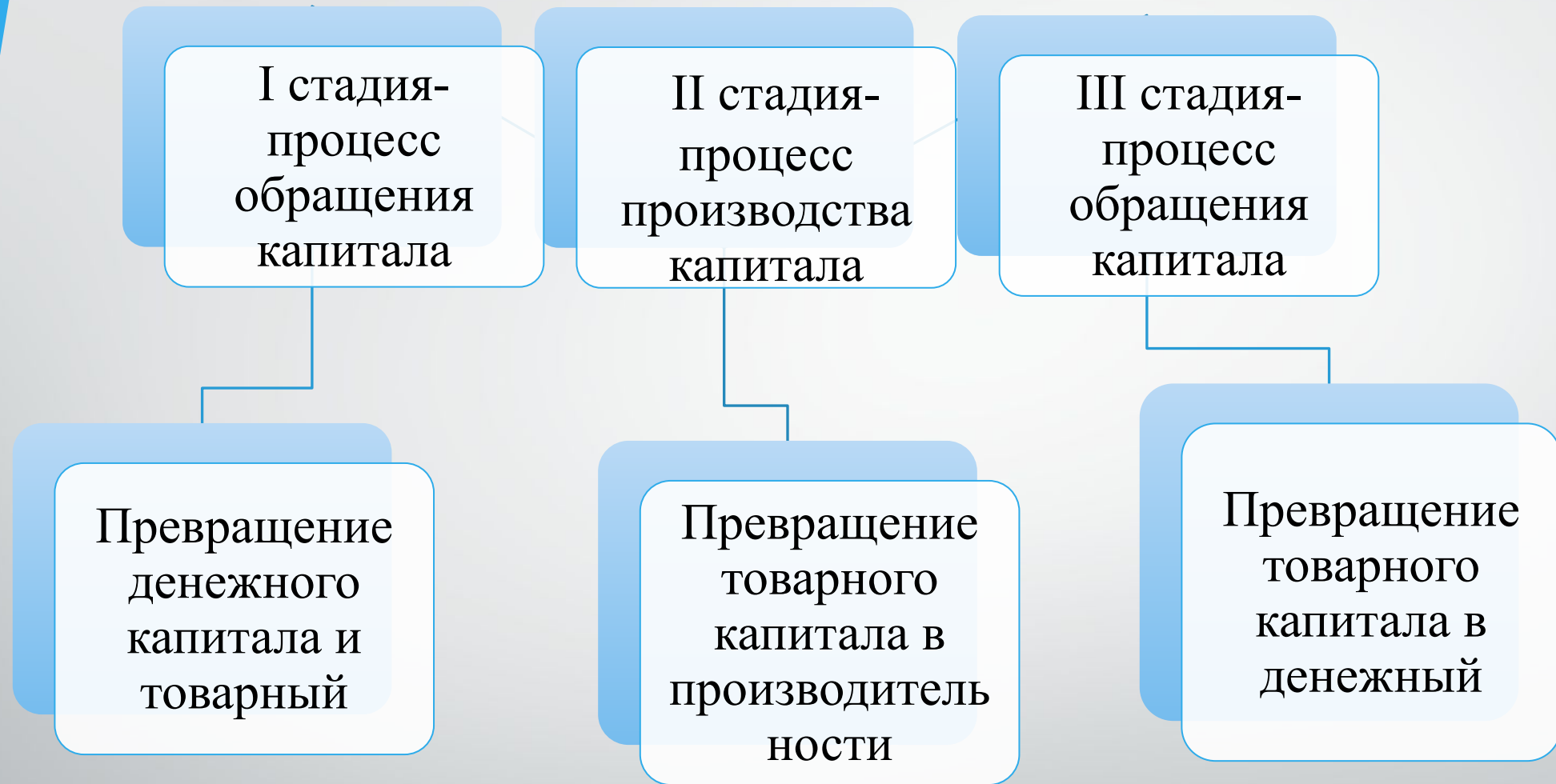
Рис. 5 Последовательные стадии и функциональные формы кругооборота промышленного капитала