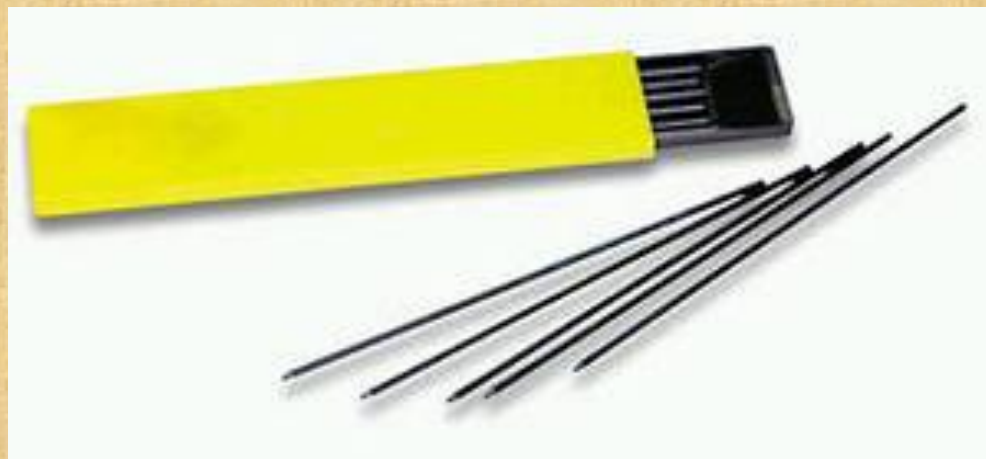
Карандаши со сменным стержнем.