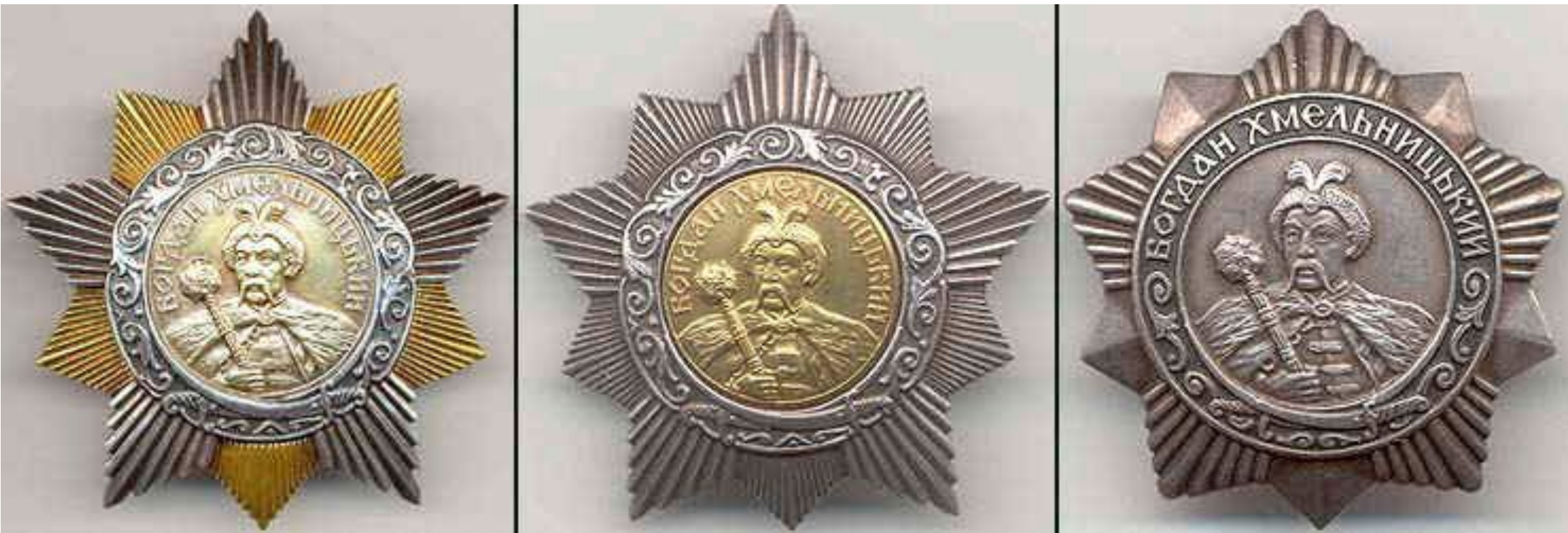
Орден Богдана Хмельницкого трех степеней