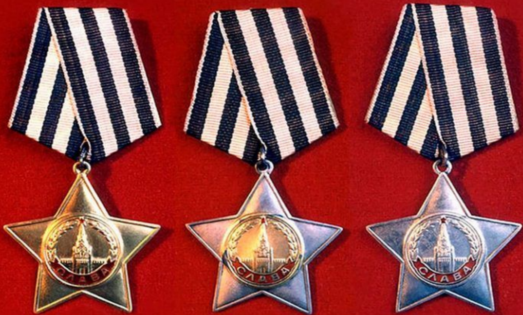
Орден Славы трех степеней (слева направо)