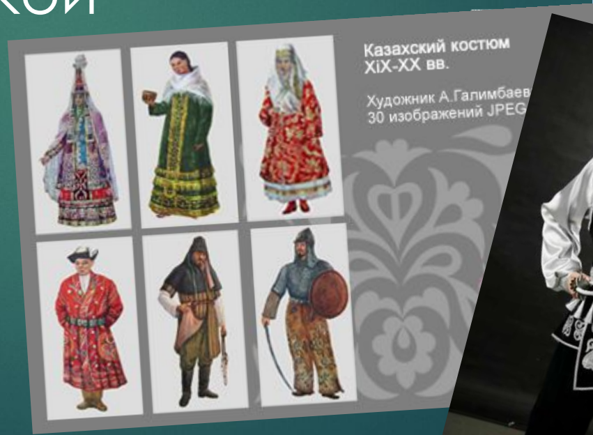
Казахский костюм XIX-XX вв. Художник А.Галимбаев 30 изображений JPEG