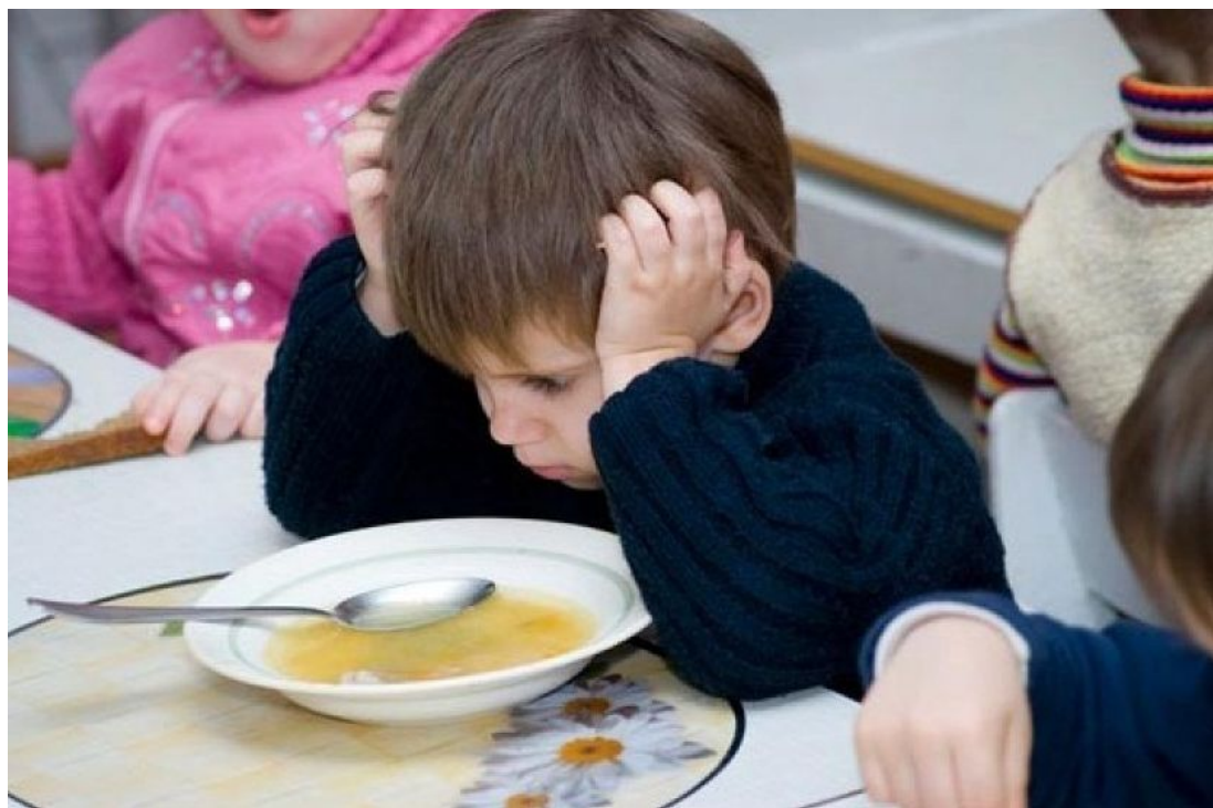
Фото-кейс «Мальчик не ест суп»